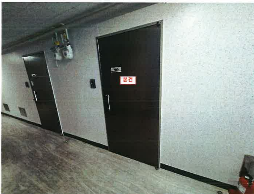
본건 현관문 전경