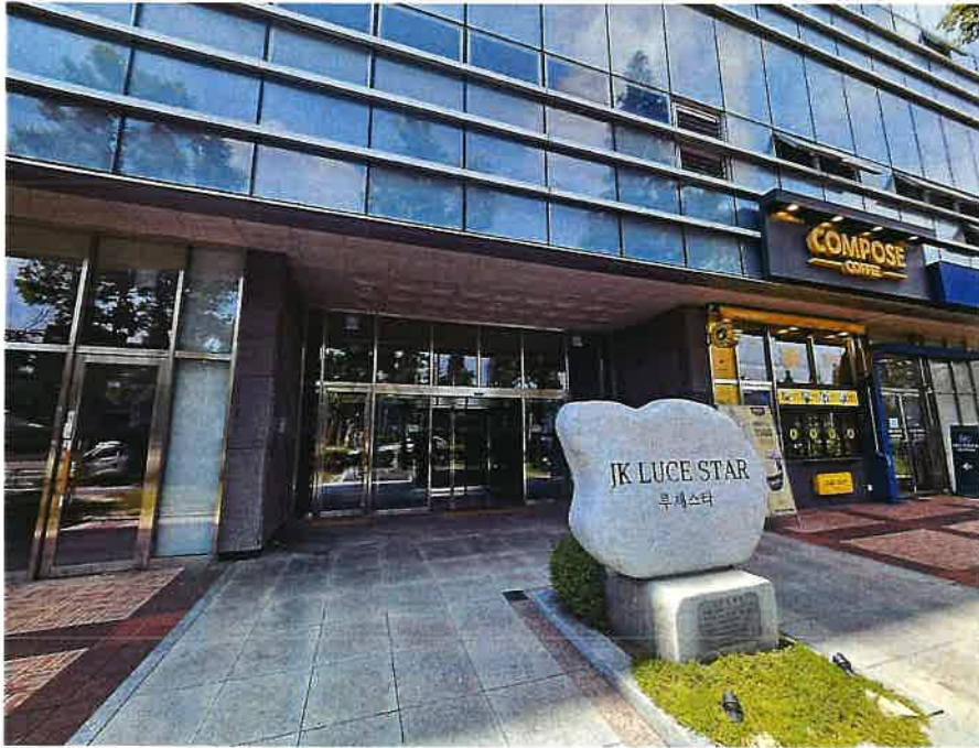
본 건물 주출입구 전경