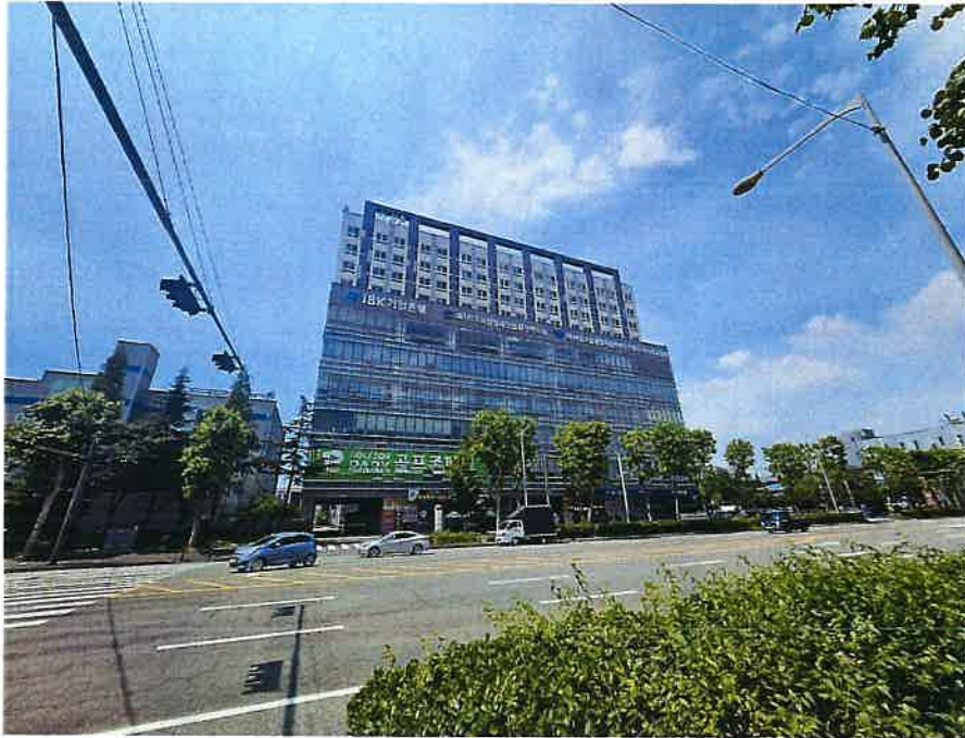
본건이 속한 건물의 전경