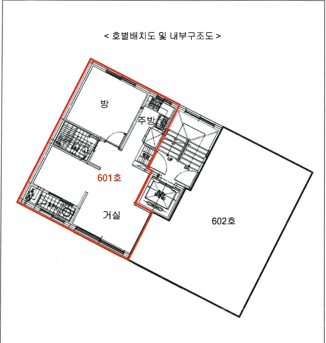
< 호별배치도 및 내부구조도 >