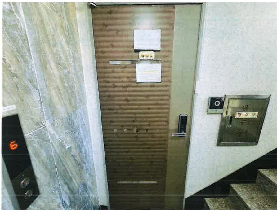
본건 현관 출입구 전경