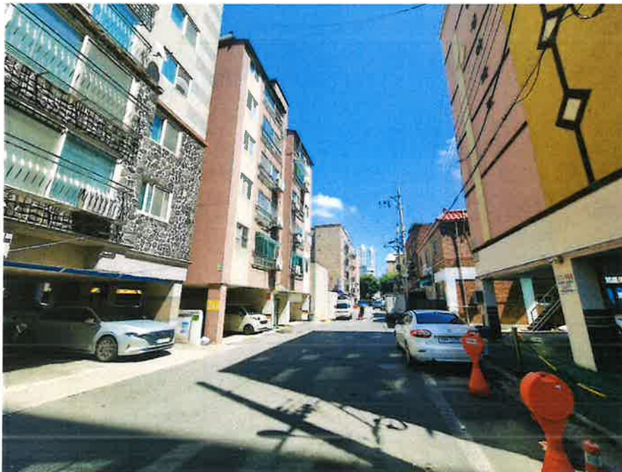
인접도로 및 인근 전경