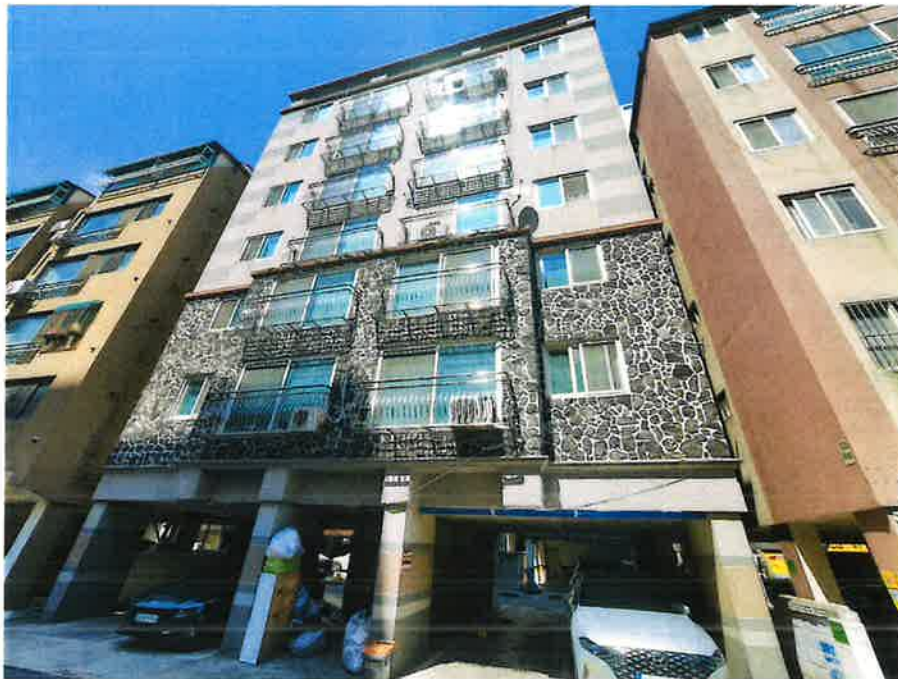
본건 소재 건물 전경