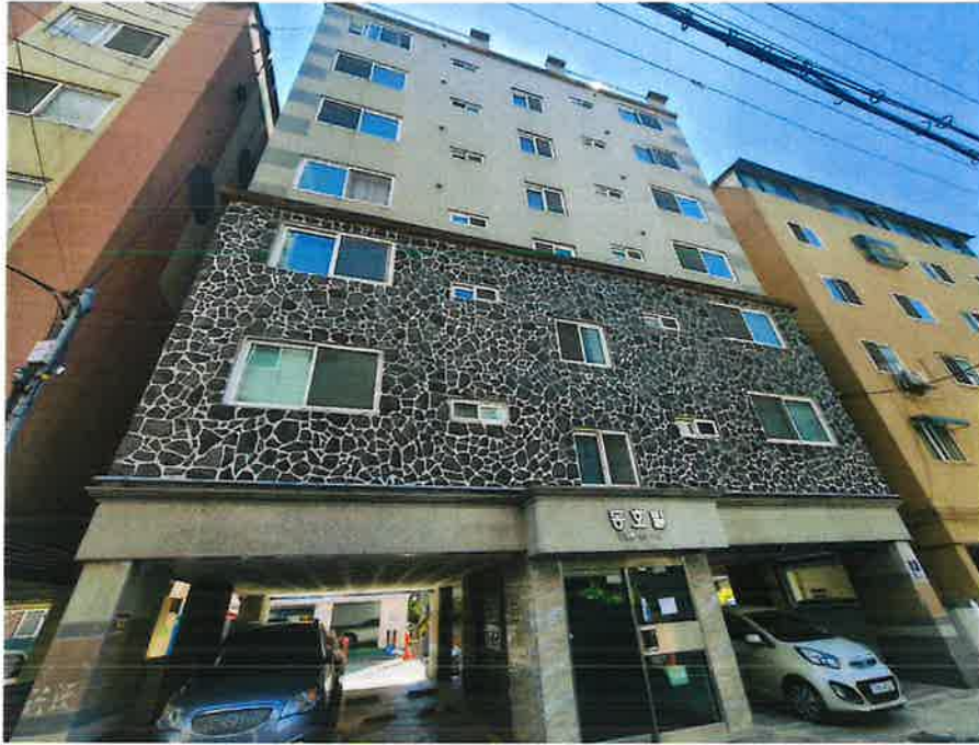
본건 소재 건물 전경