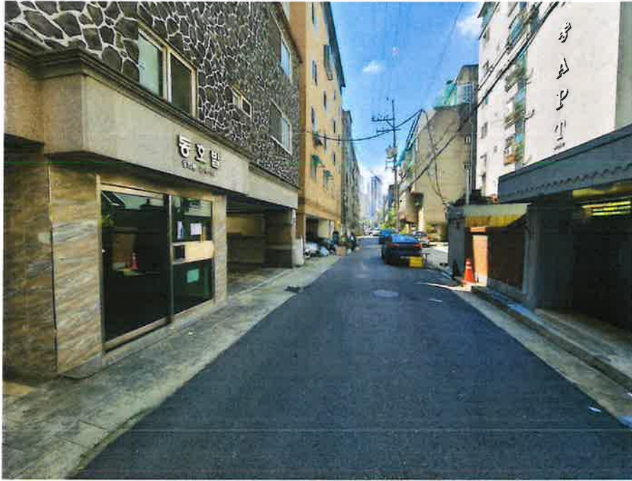
인접도로 및 인근 전경