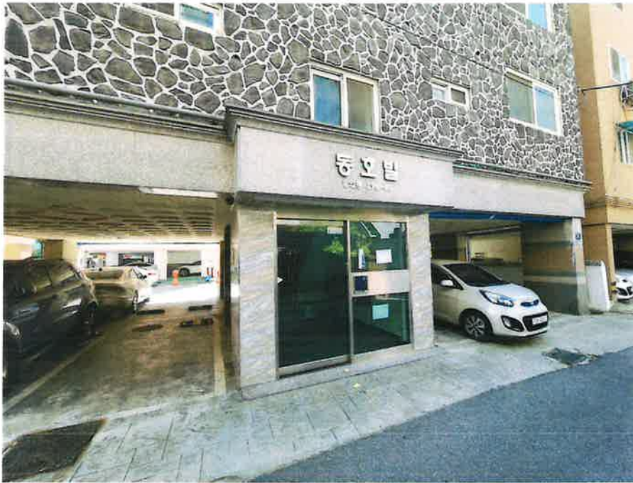
1층 공동 출입구 전경