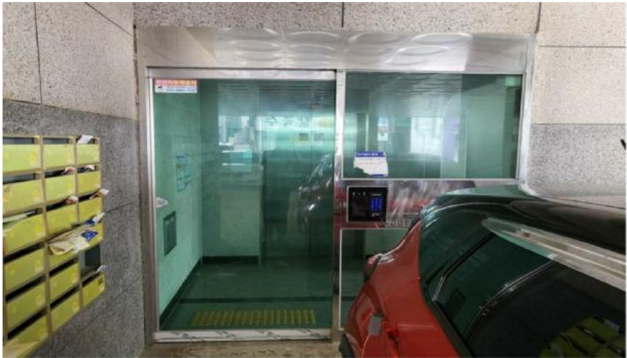
본 건 출입 구(1층)