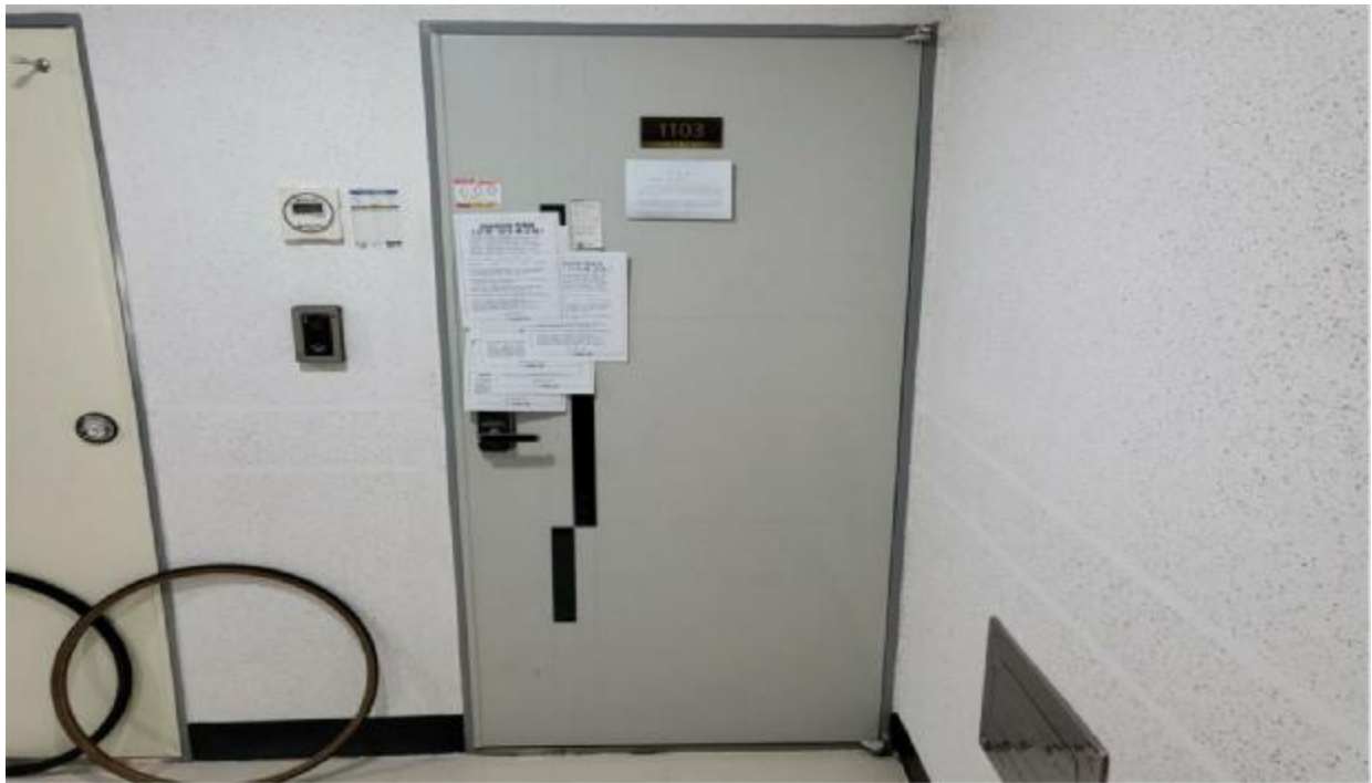
본 건 현 관