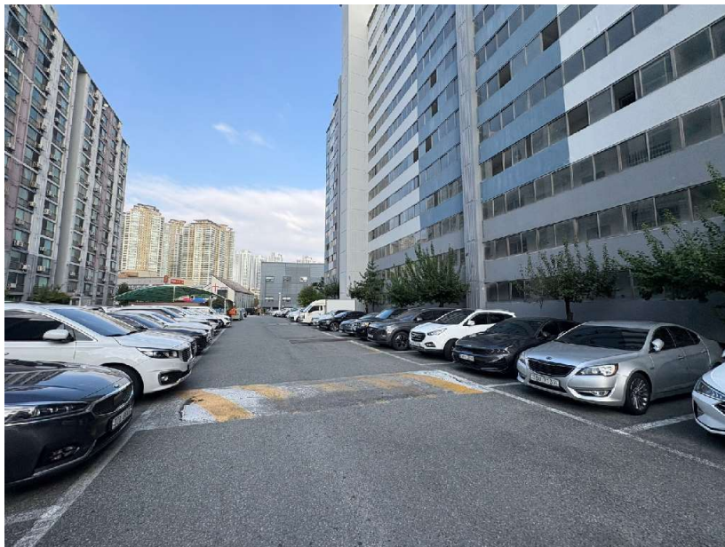
본건 단지 전경