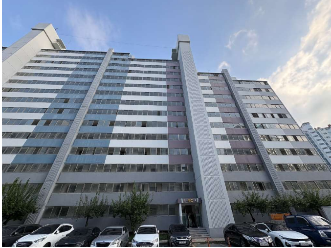
본건 건물 전경