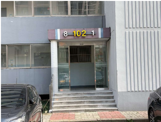
본건 건물 입구