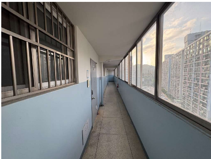
본건 건물 10층 전경