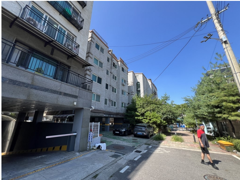
[ 본건전경 ]