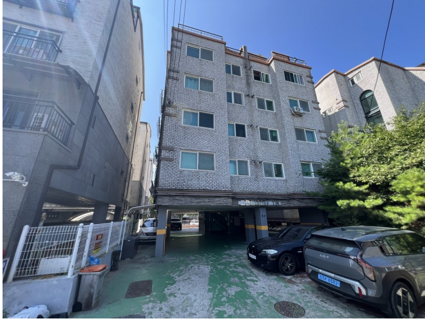
[ 본건전경 ]