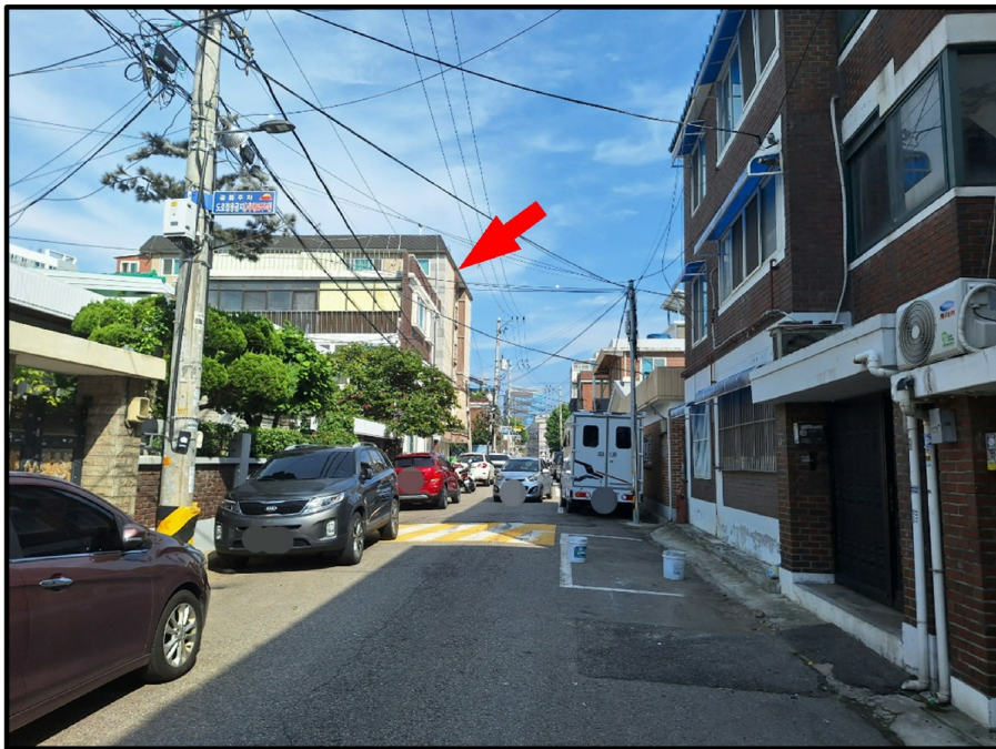
[ ( ) - ]