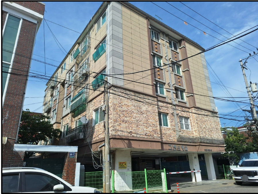
[ - ]