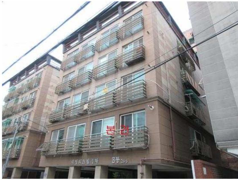
본건 전경 : 본건 [북서측]에서 촬영