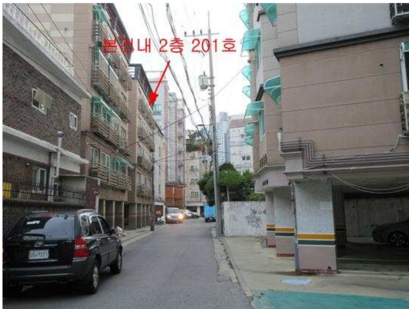
주위환경 : 본건 [북동측]에서 촬영