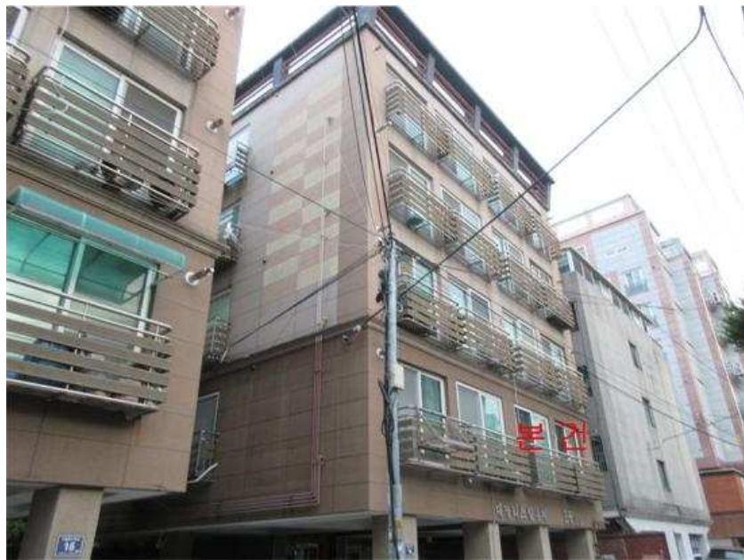
본건 전경 : 본건 [북동측]에서 촬영