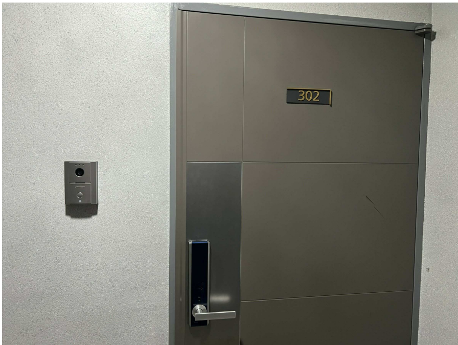
본건 외부 현황