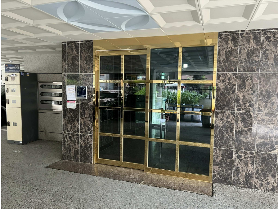
1층 출입부 부분