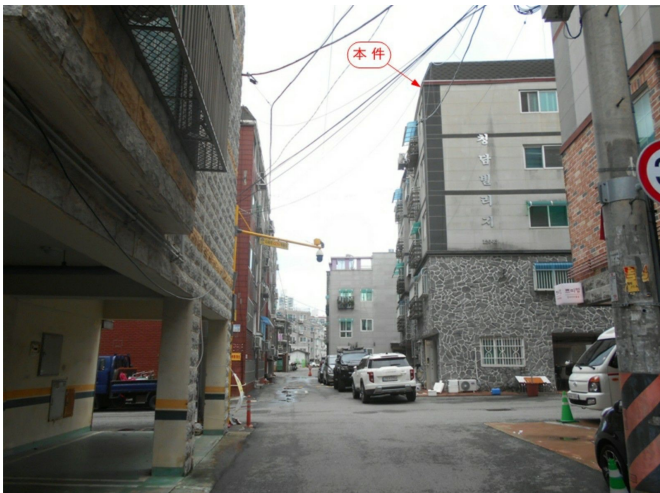
주변 전경(남서측 인근에서 촬영)