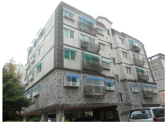
본건 전경2(북서측 인근에서 촬영)