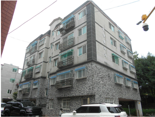
본건 전경1(남서측 인근에서 촬영)