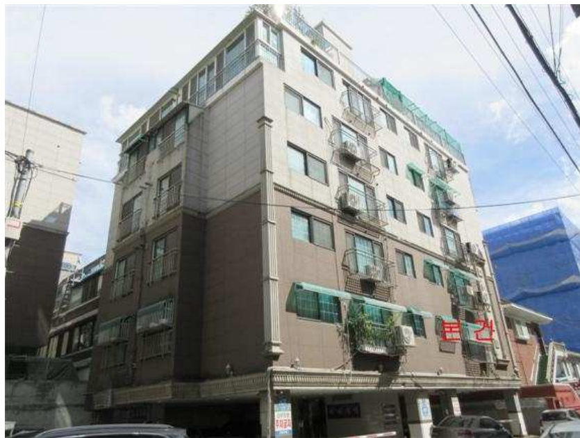
본건 전경: 본건 [북서측]에서 촬영