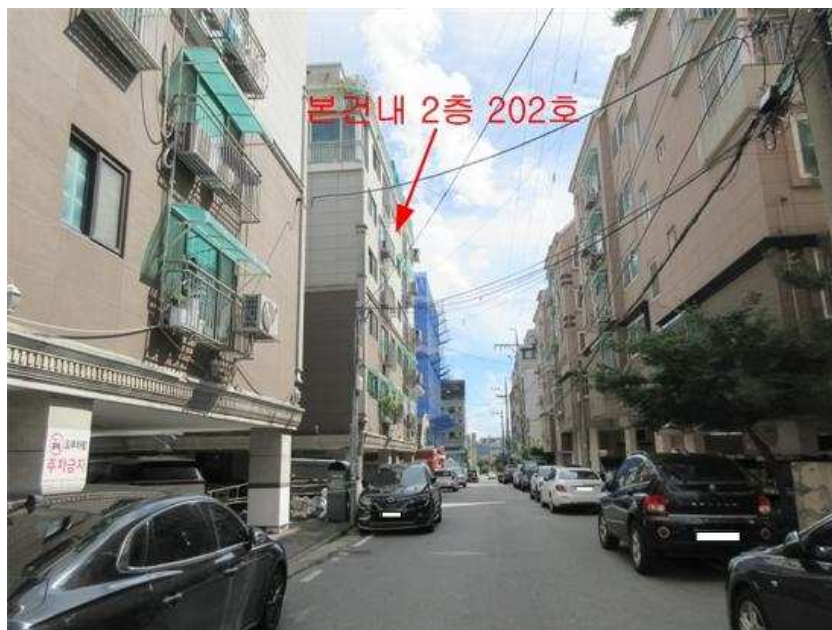
주위환경 : 본건 [북서측]에서 촬영