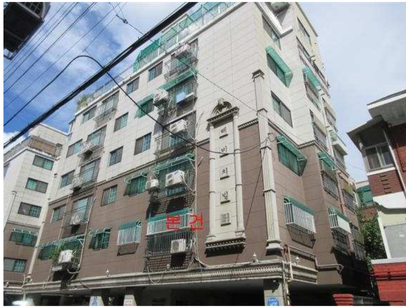
본건 전경: 본건 [남서측]에서 촬영