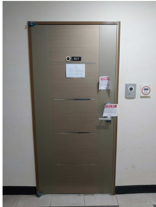
본건 현관 전경