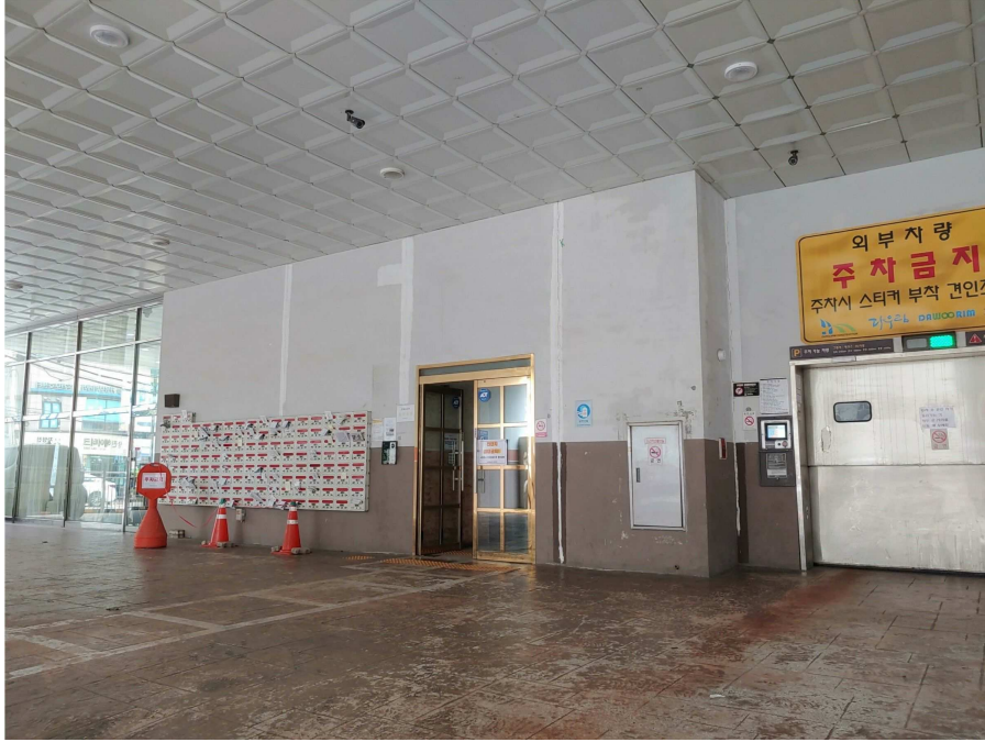
1층 공용출입구 전경