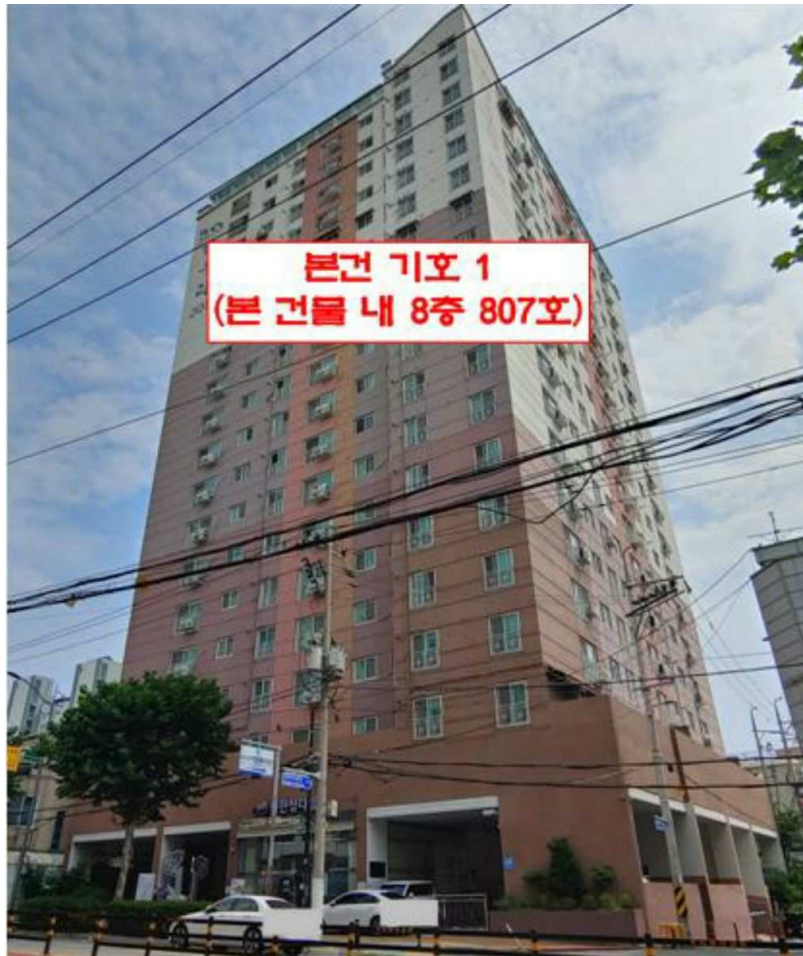
본건 전경(기호 1)