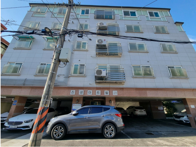
본건 건물 전경