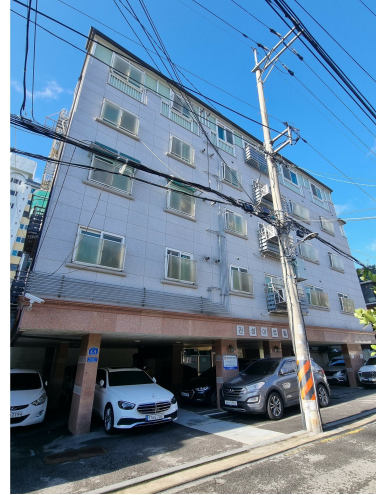
본건 건물 전경