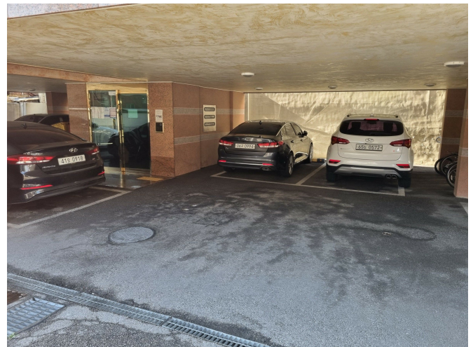
건물 입구 및 주차장