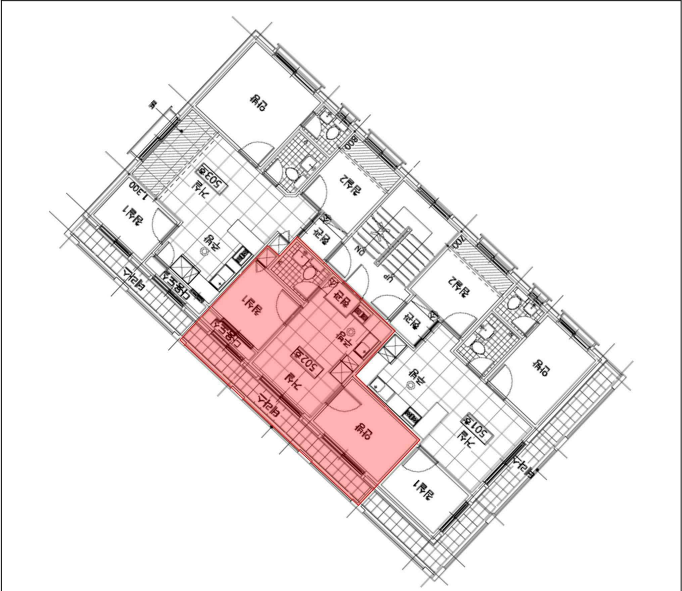
5층 502호 내부구조도

소재지 서울특별시 은평구 구산동 323-15, -18 진성아트빌 5층 502호