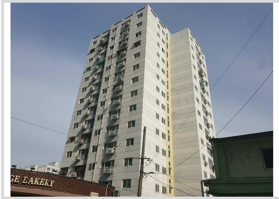
남측 건물 전경