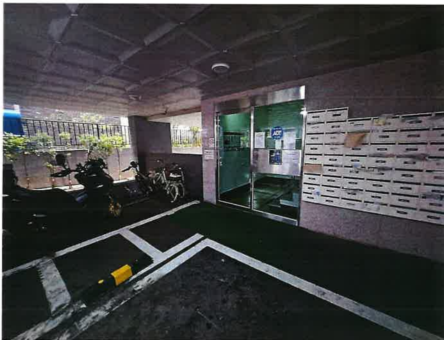
본 건물 주출입구 전경