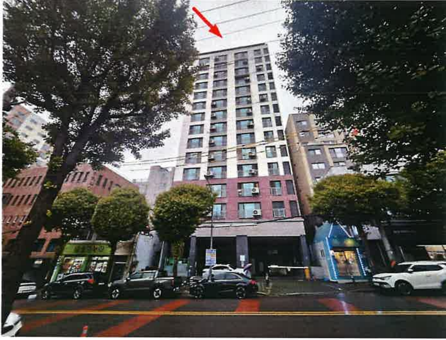
본건이 속한 건물의 전경