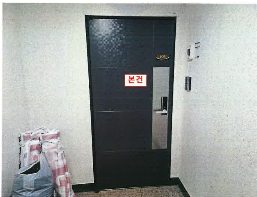
본건 현관문 전경