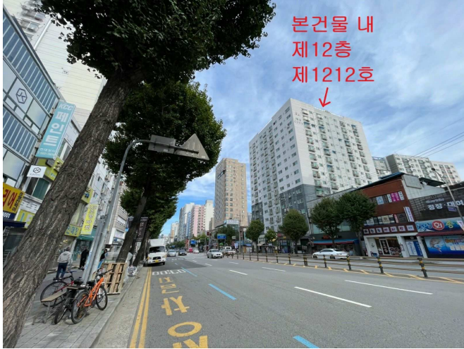
본건물 인근 전경