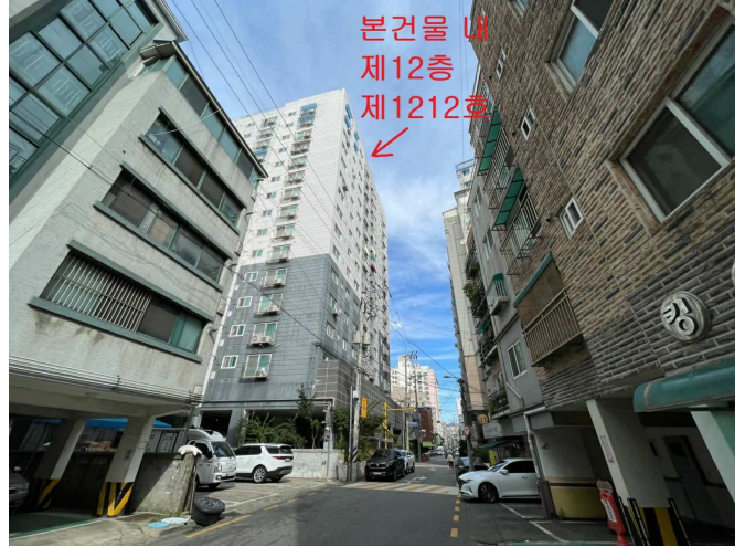
본건물 인근 전경