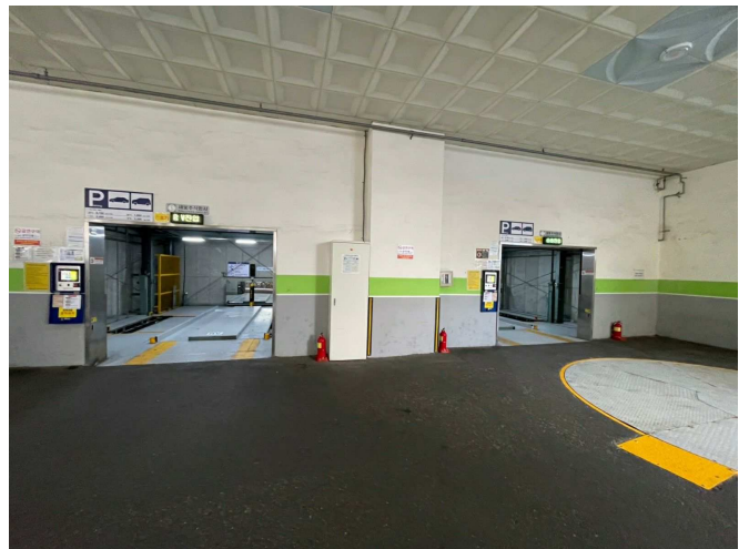
본건물 기계주차 설비