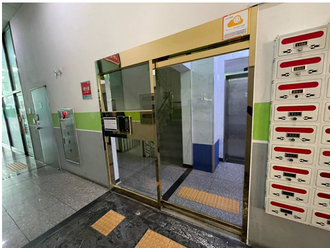
본건물 1층 출입구