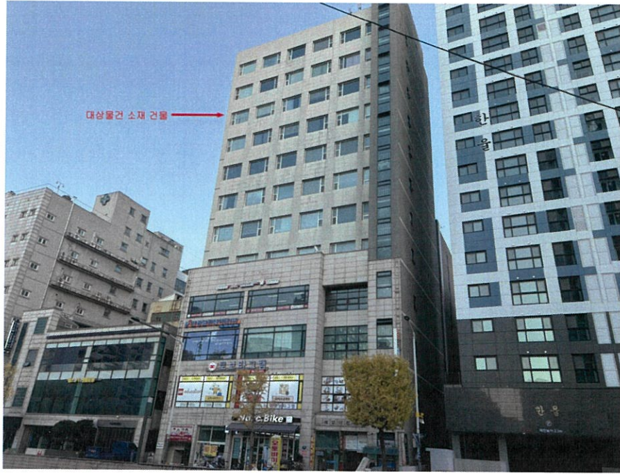
대상물건 소재 건물 전경