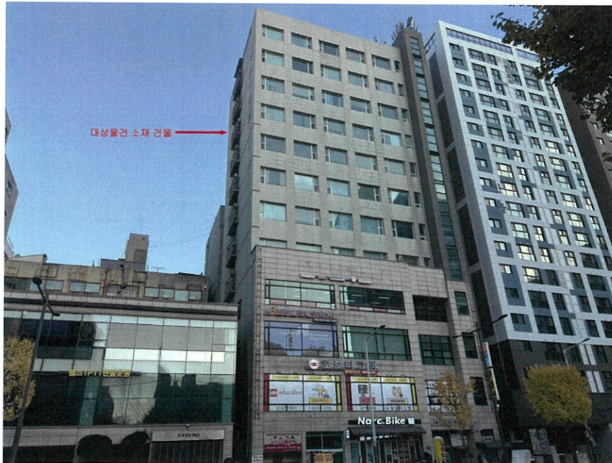
대상물건 소재 건물 전경