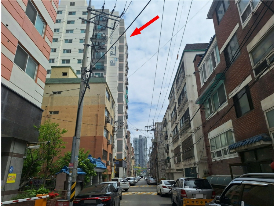
[ - ]