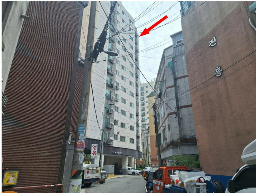
[ - ]