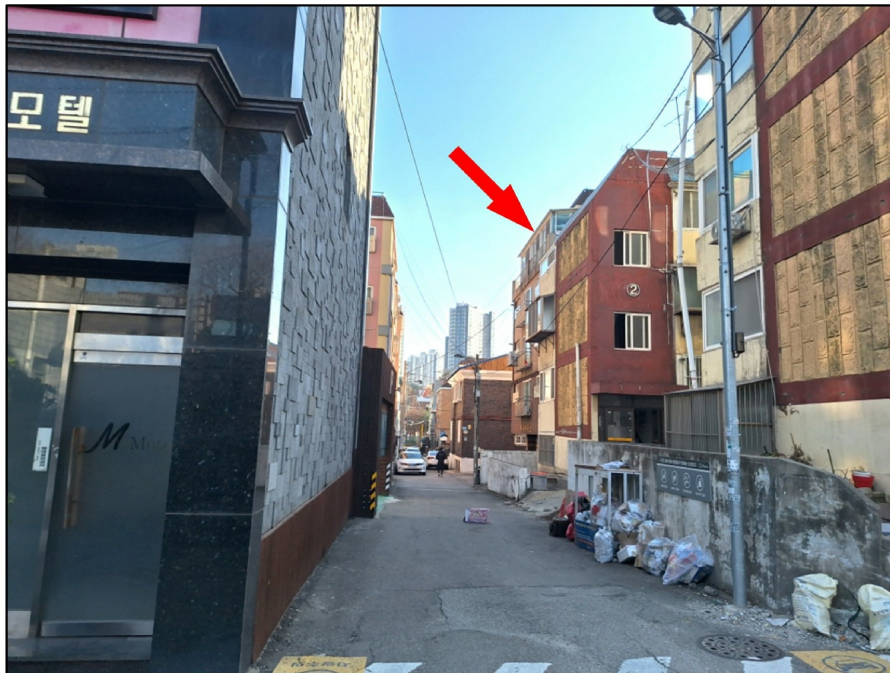
[ ( ) - ]