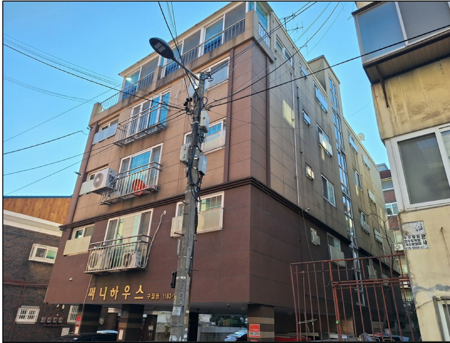
[ - ]