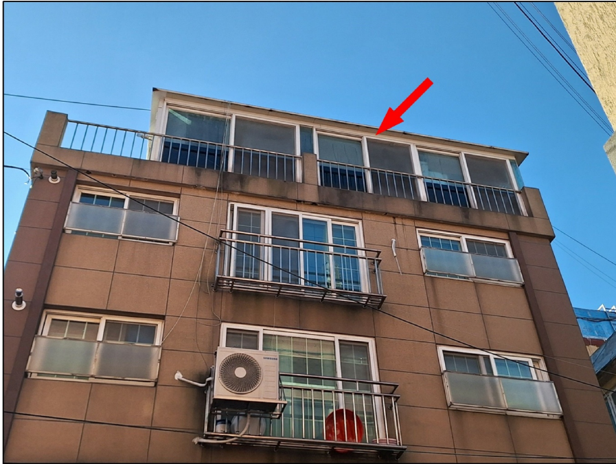
[ ( ) ]