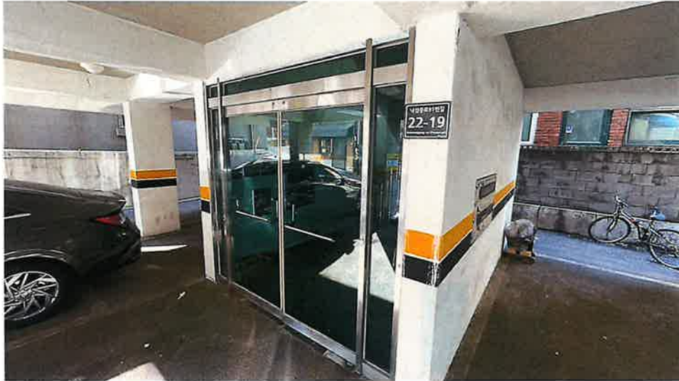
공동 현관 전경