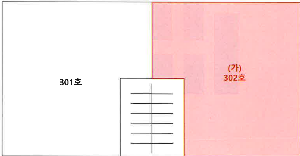
< 호 별 배 치 도 >