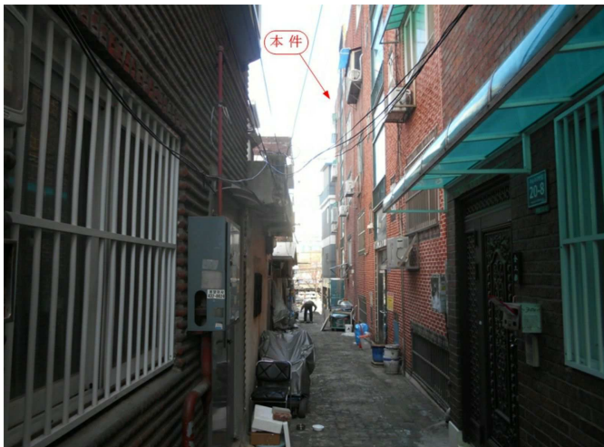
주변 전경2(서측 인근에서 촬영)