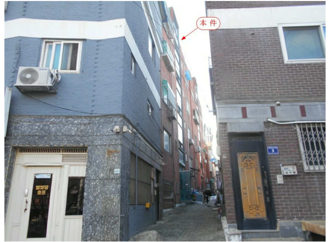
주변 전경1(동측 인근에서 촬영)