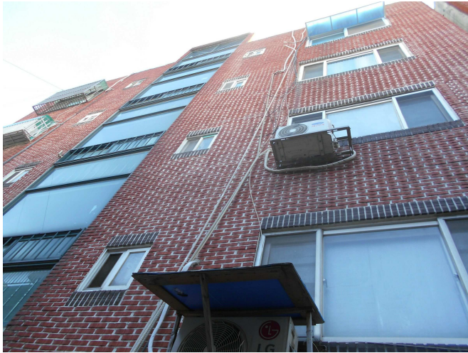
본건 전경(북측에서 근접 촬영)