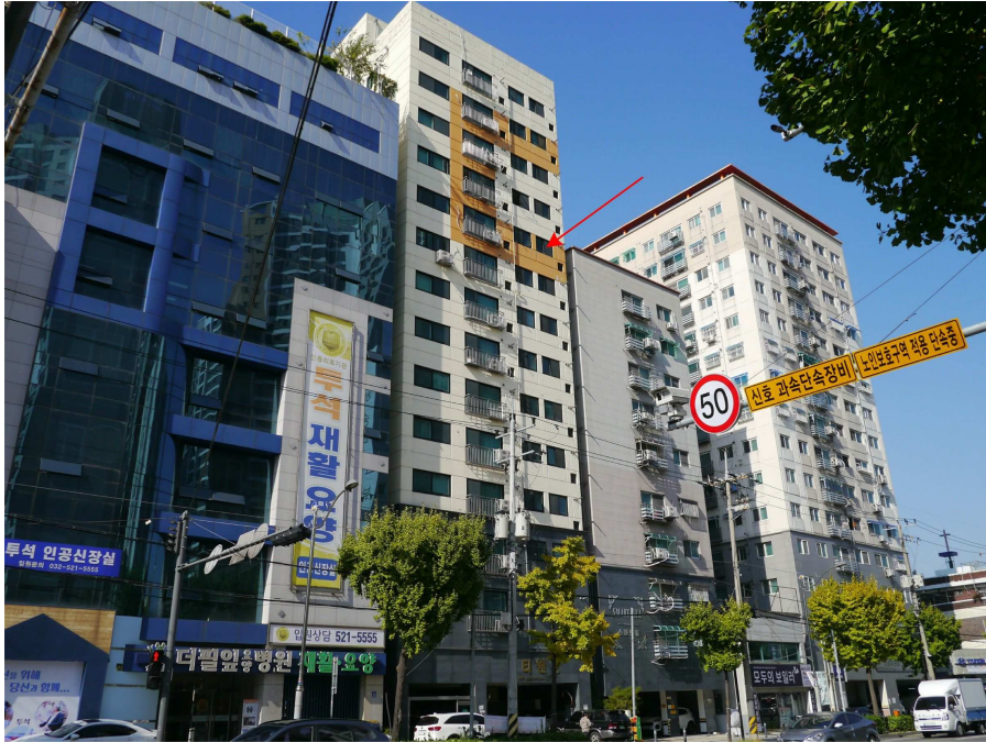
본건 외부 모습(남동측에서 촬영)