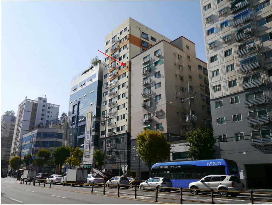
본건 외부 전경(북동측에서 촬영)