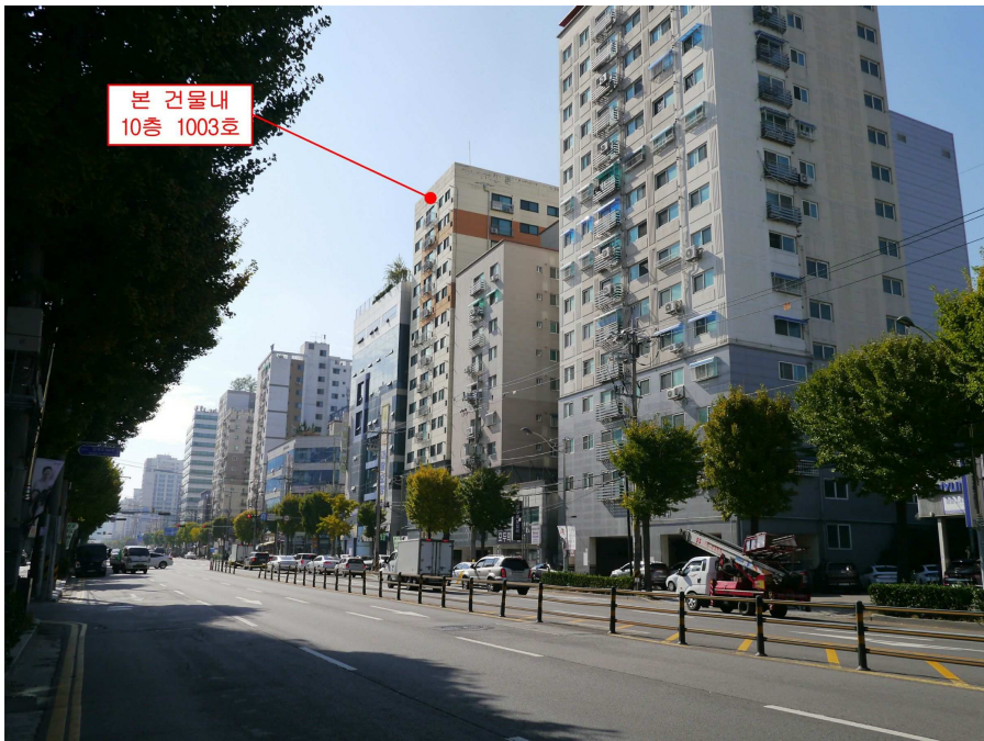
본건 주위환경(동측 도로변 모습)