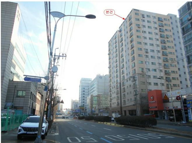
주변 전경(북서측 인근에서 촬영)