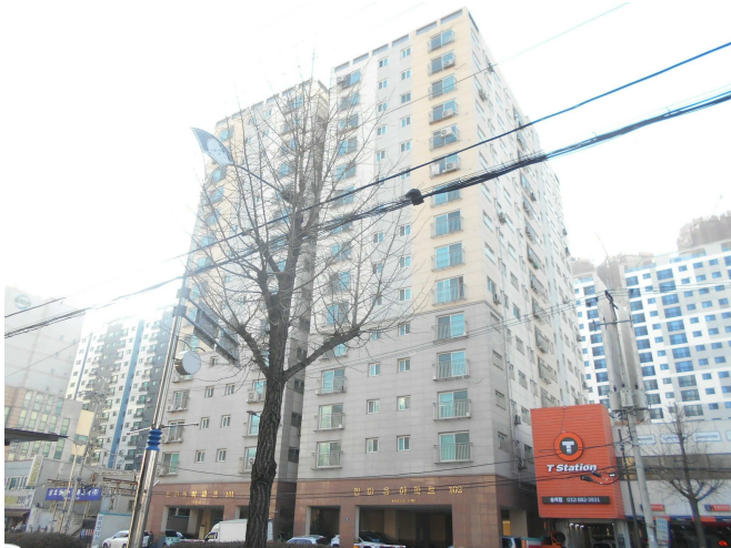
본건 전경1(북측 인근에서 촬영)