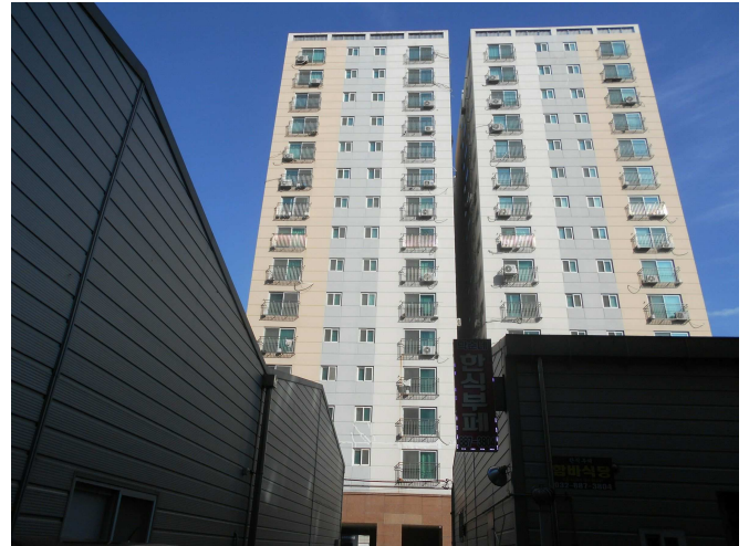
본건 전경2(남측 인근에서 촬영)