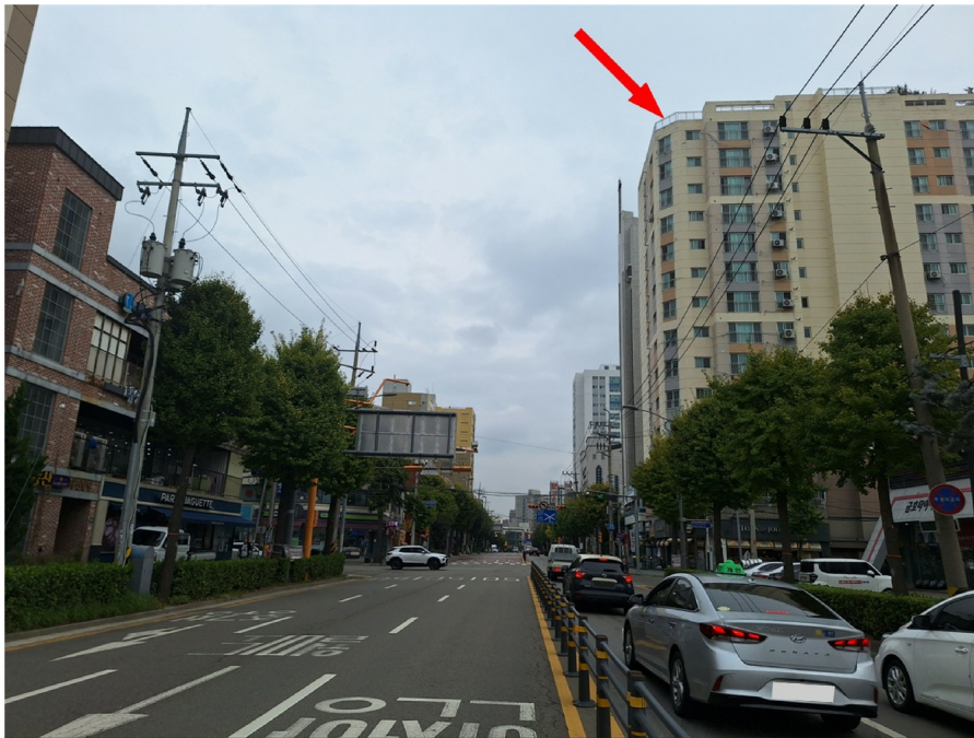
[ ( ) - ]