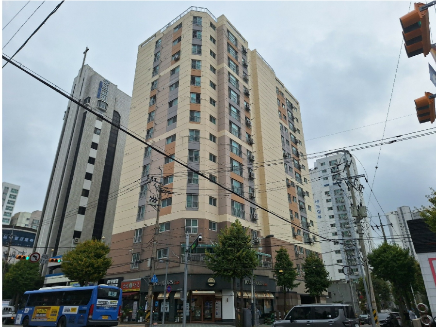
[ - ]