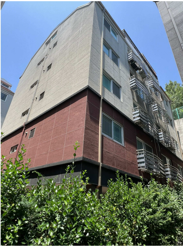
본건 전경 1