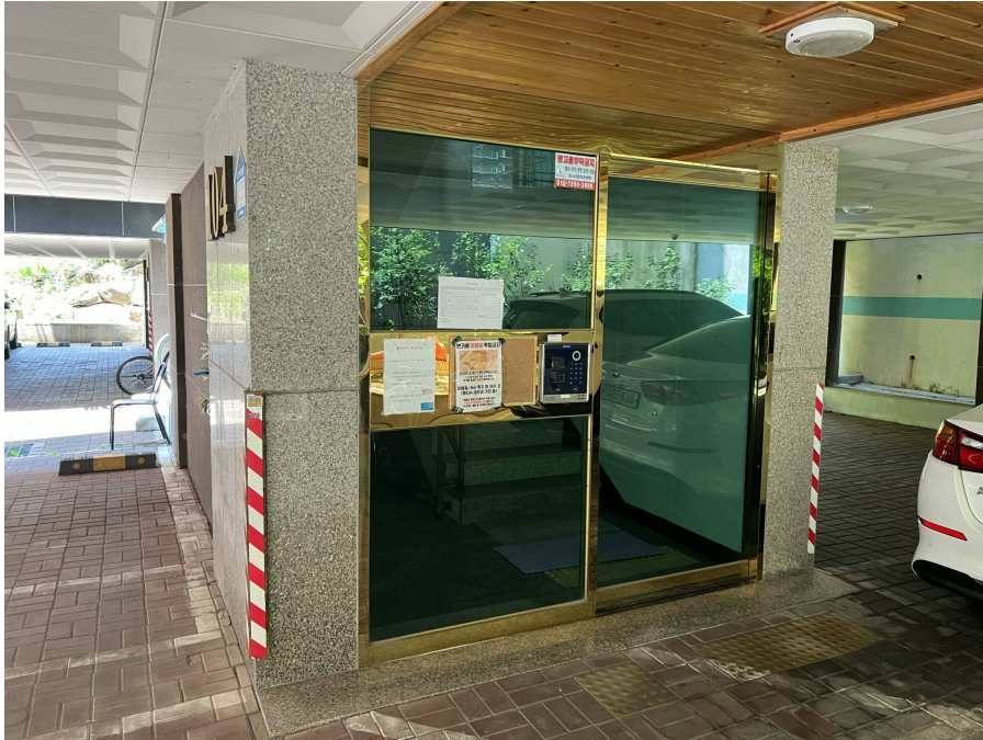
1층 출입부 부분