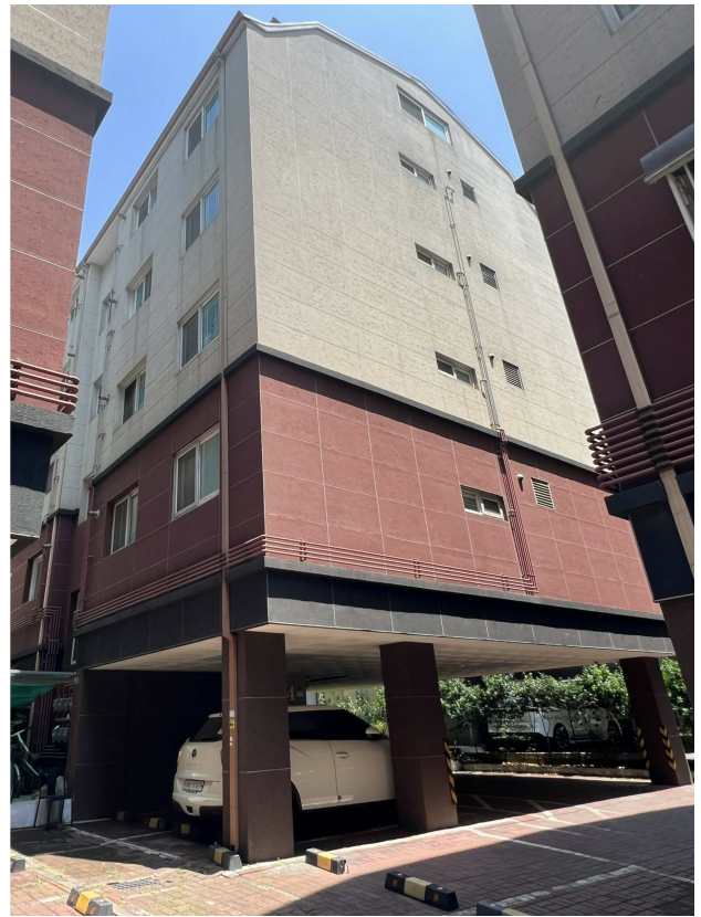
본건 전경 2