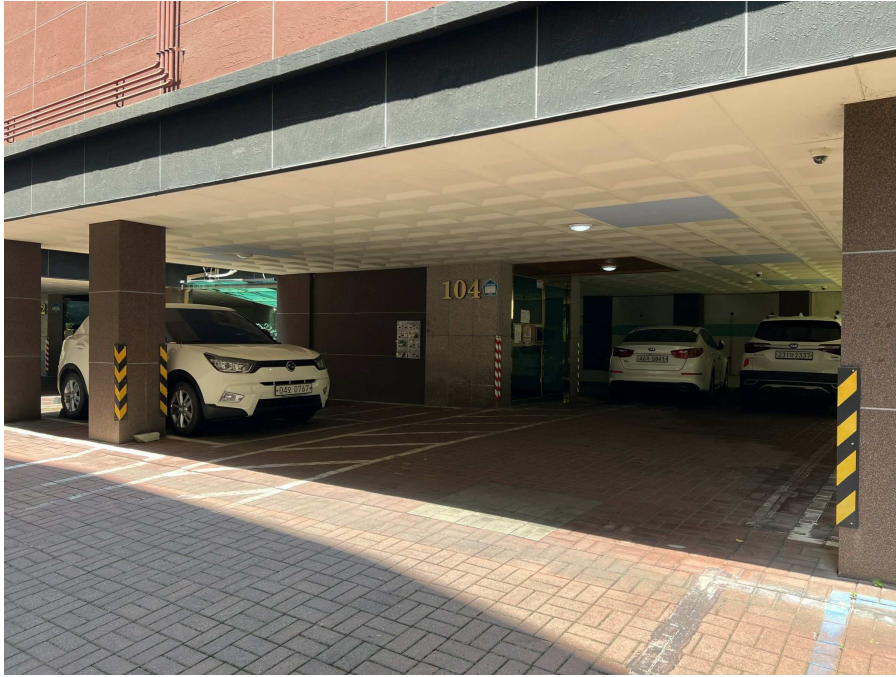
1층 주차장 부분