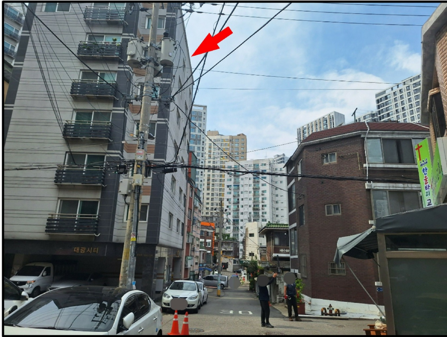
[ ( ) - ]