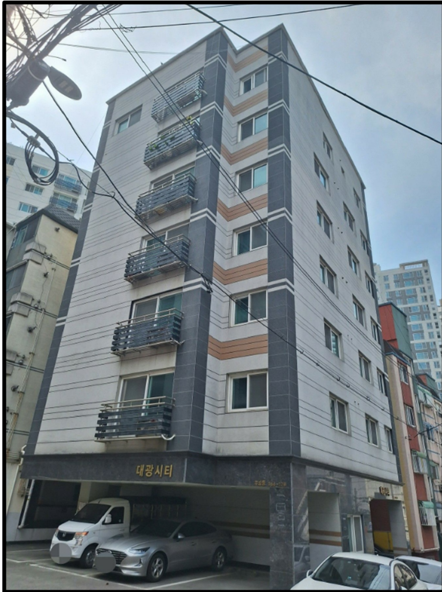
[ - ]