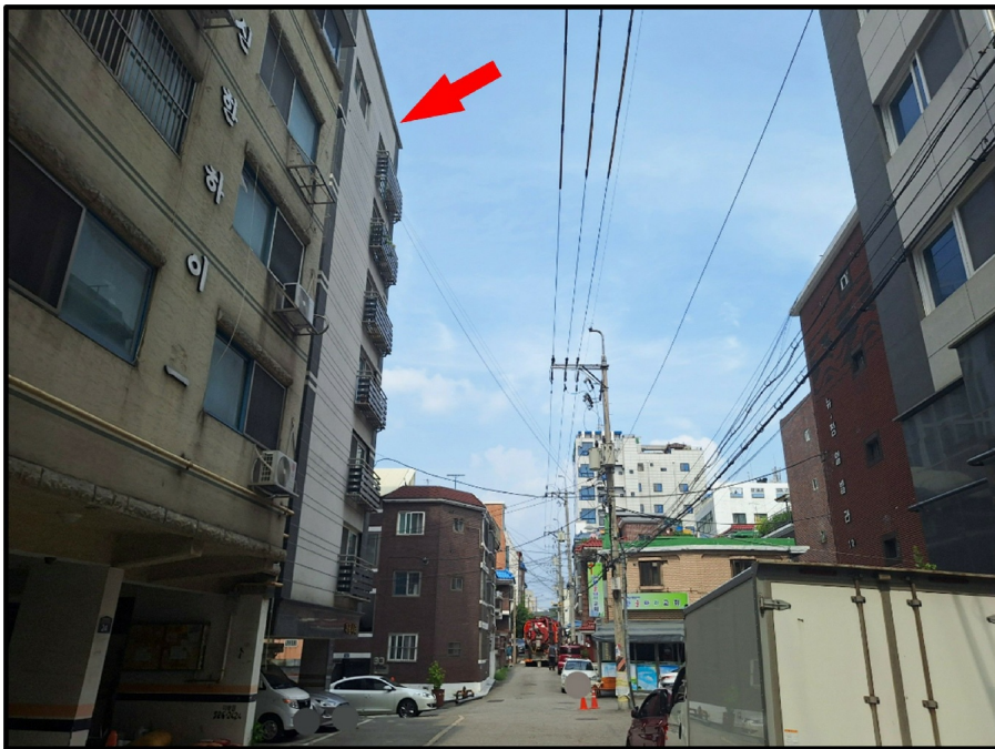
[ ( ) - ]