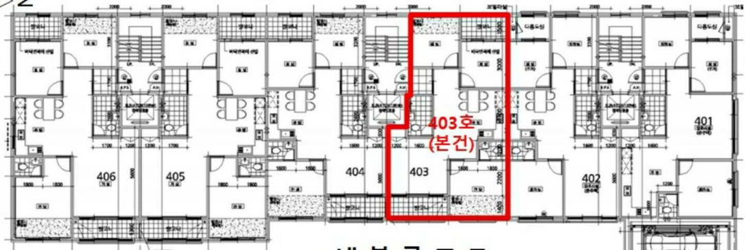
< 내부구조도 >