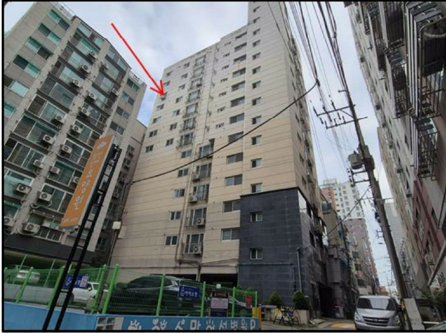
[ 본건이 소재하는 건물 ]