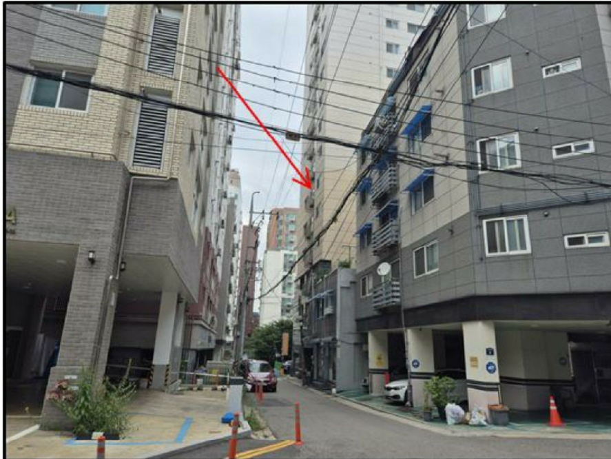
[ 주위환경 등 ]