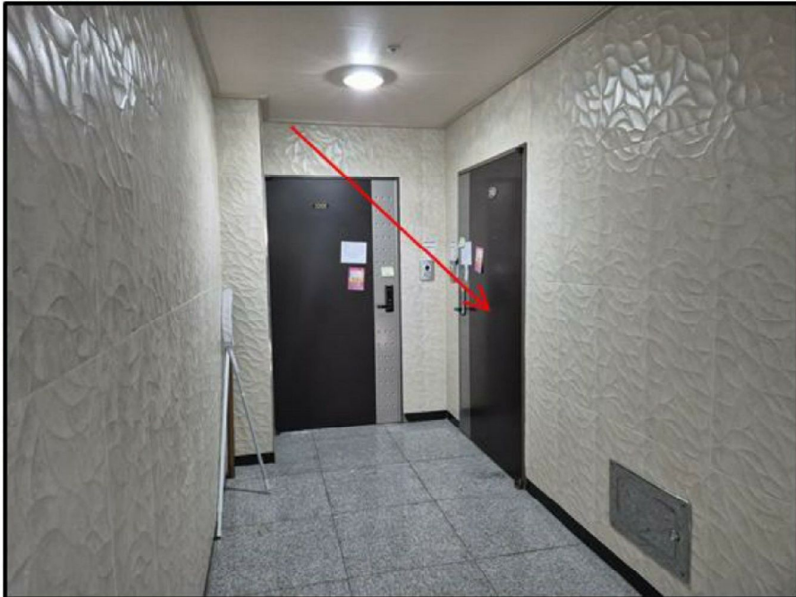
[ 본건 출입문 ]