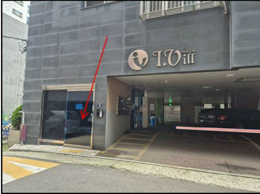
[ 본건 소재 건물 1층 공동출입구 ]