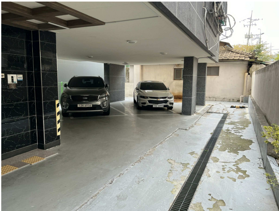
1층 주차장부분 2