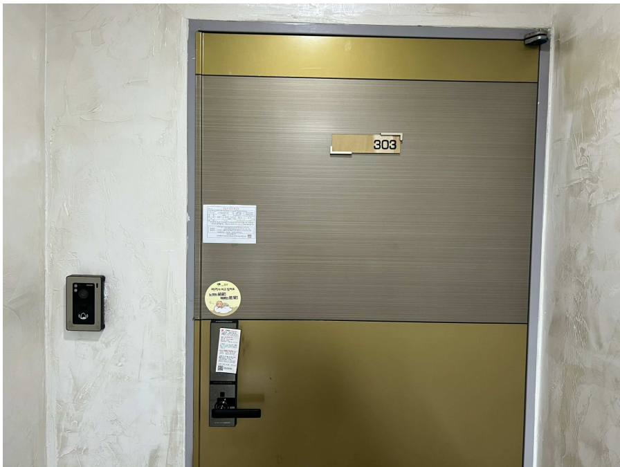
본건 외부 현황