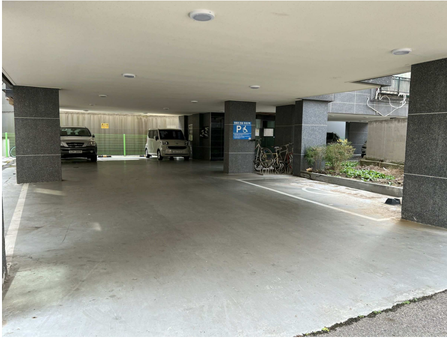
1층 주차장부분 1