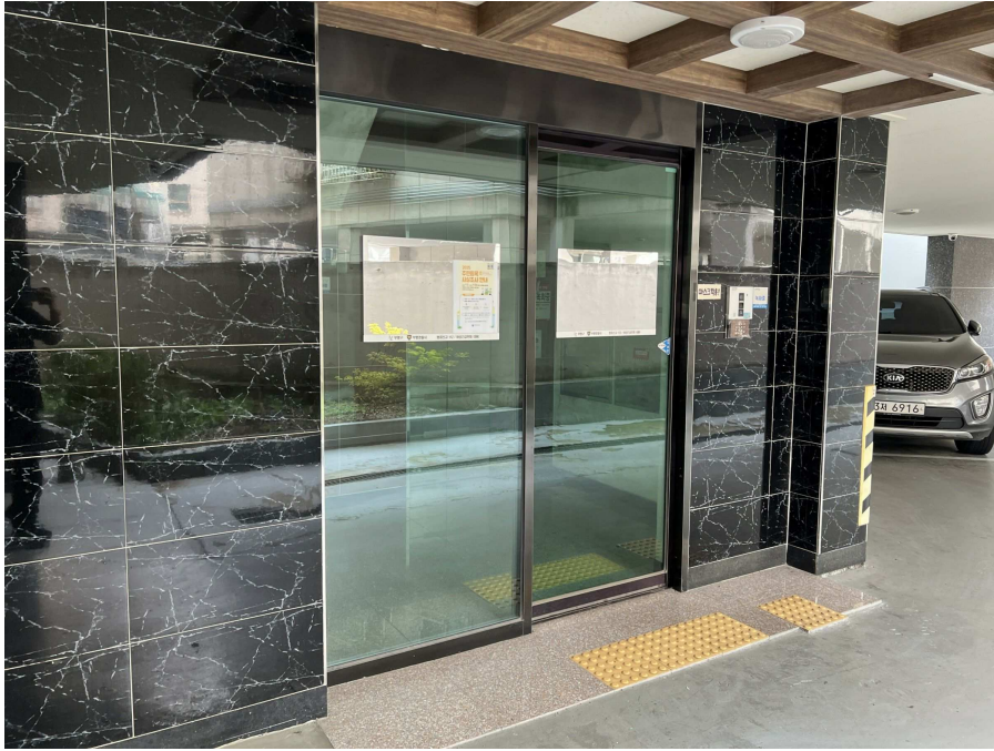
1층 출입부 부분