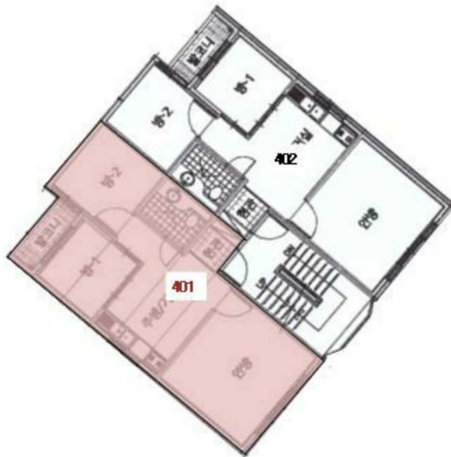
[ 4층 호별배치도 ]