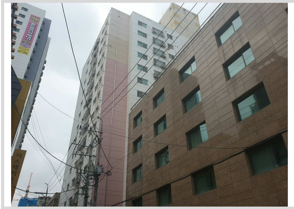
건물 남동측 전경