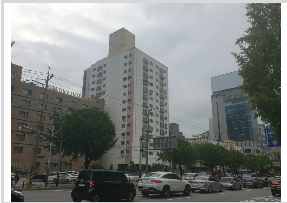
건물 남서측 전경