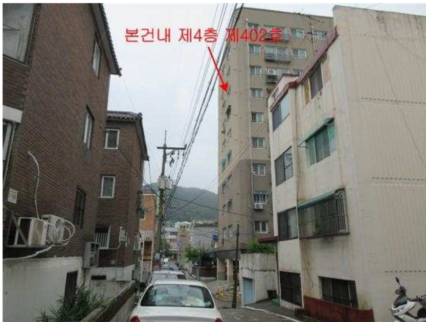
주위환경 : 본건 [남동측]에서 촬영