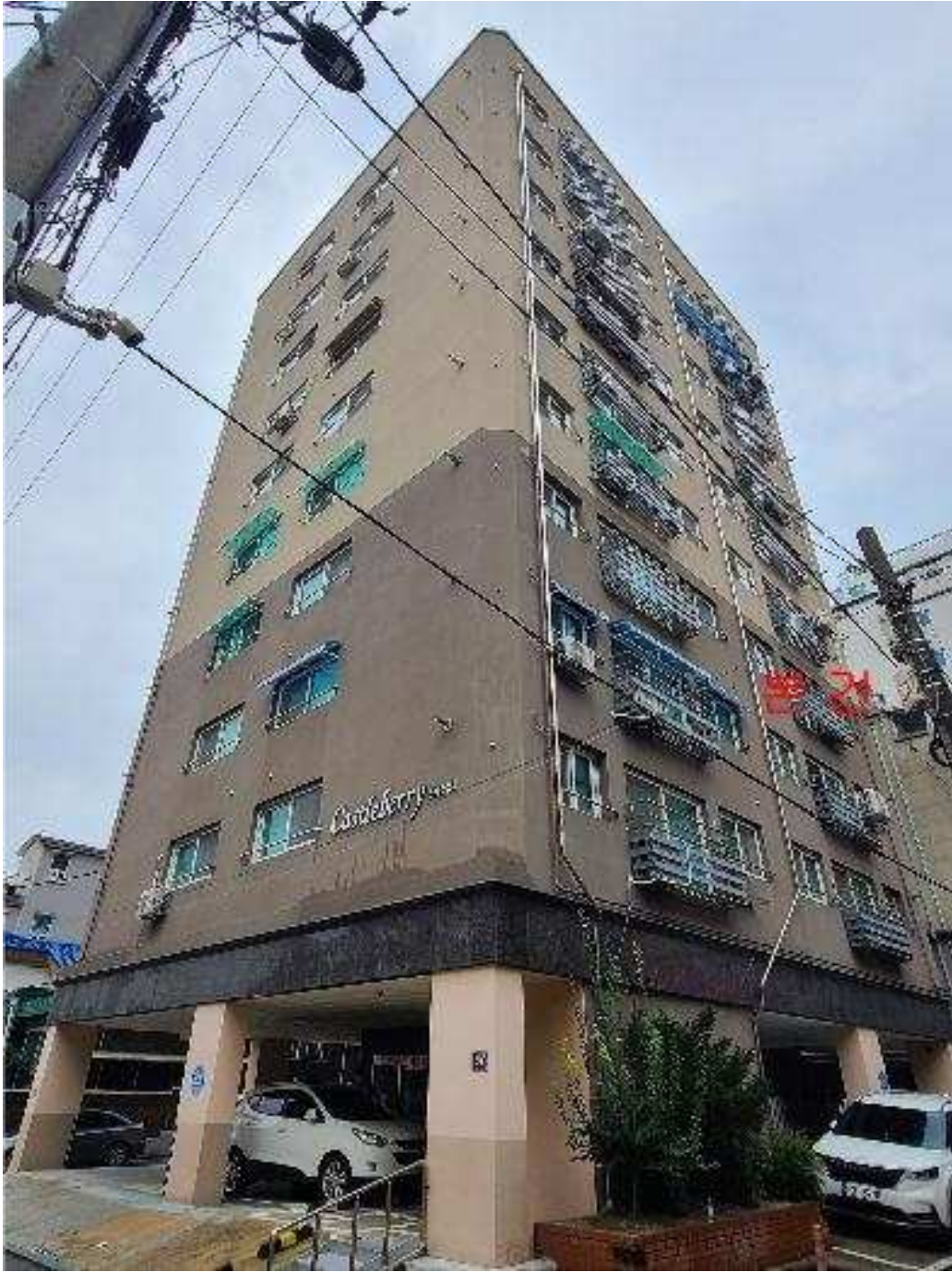
본건 전경 : 본건 [남측]에서 촬영