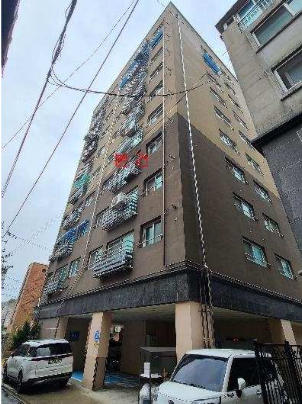
본건 전경 : 본건 [동측]에서 촬영