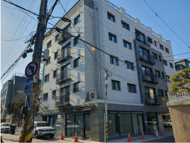
본건 건물 전경