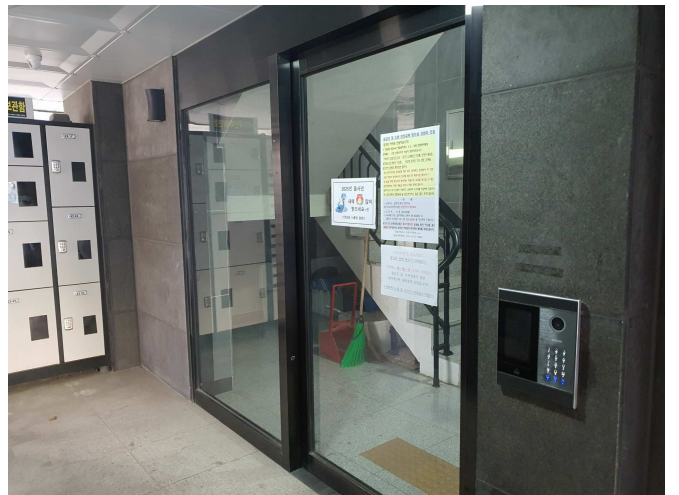
지 상 출 입 부