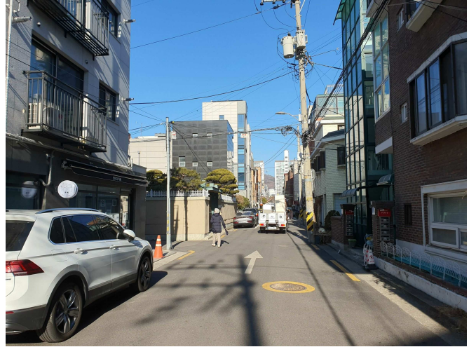
주 위 환 경