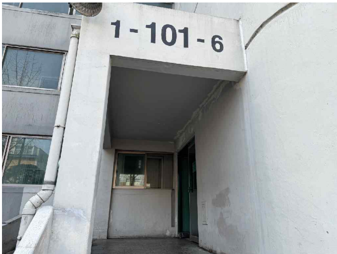
대상물건 전경[공동현관에서 촬영]