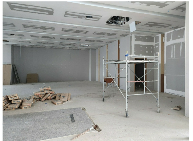
( 805 )