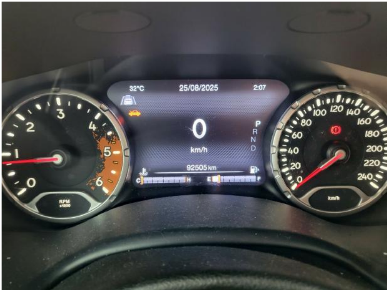
계 기 판