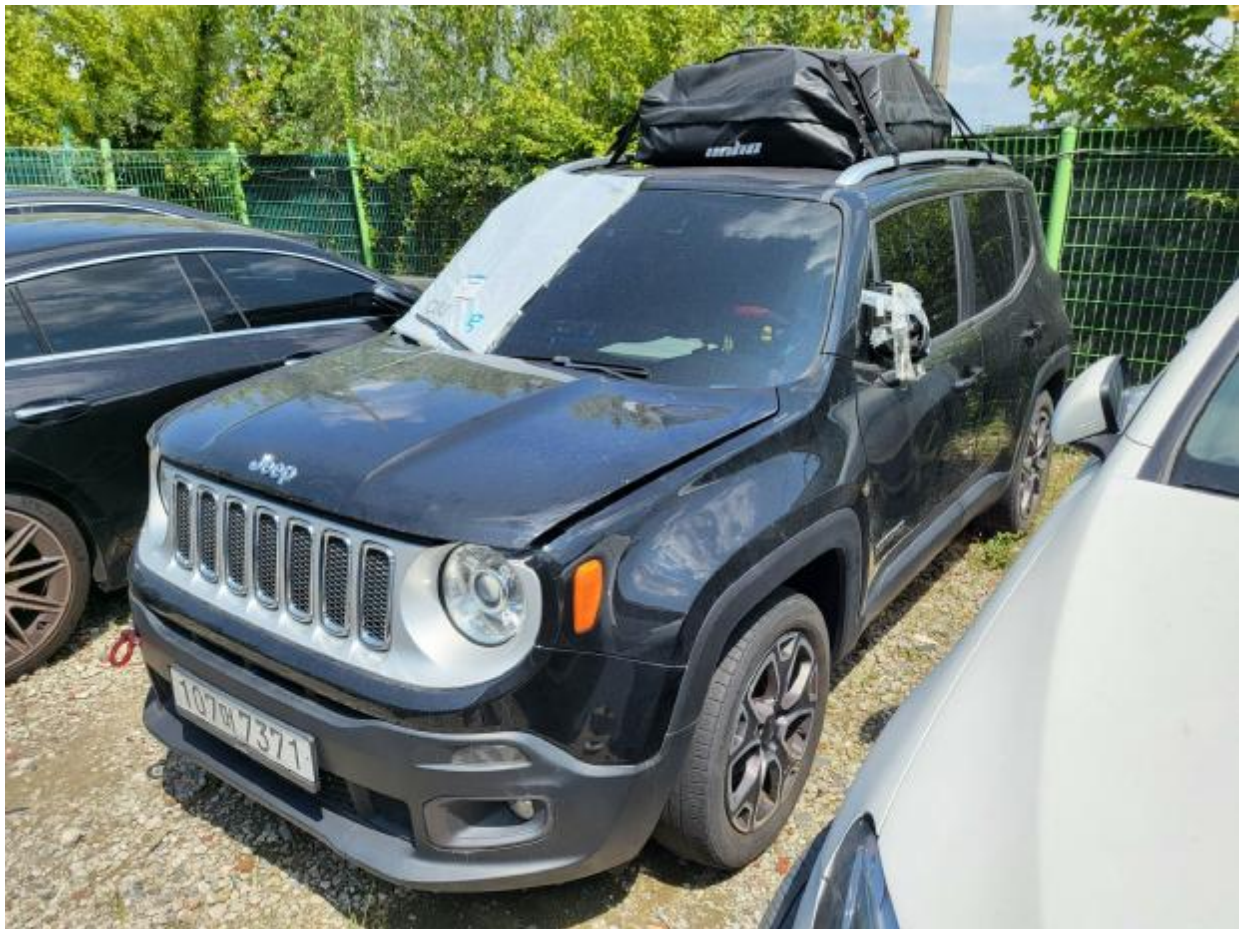
본 건 측면