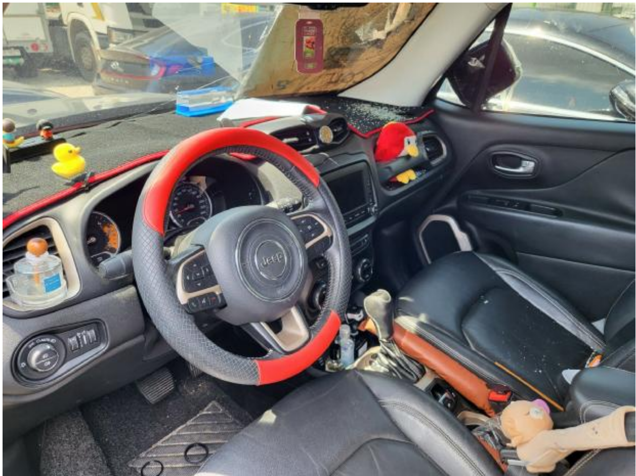
본 건 내 부