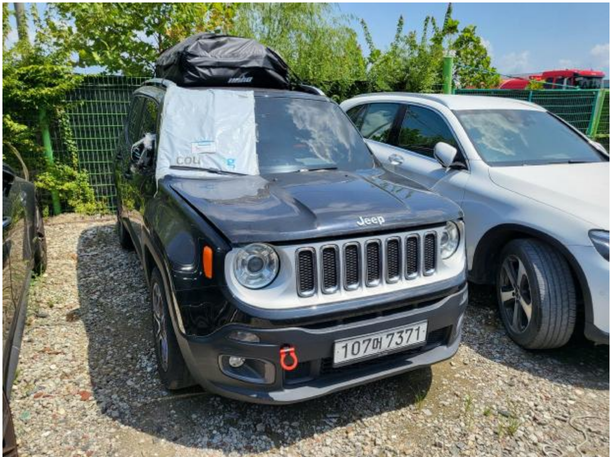
본 건 측 면