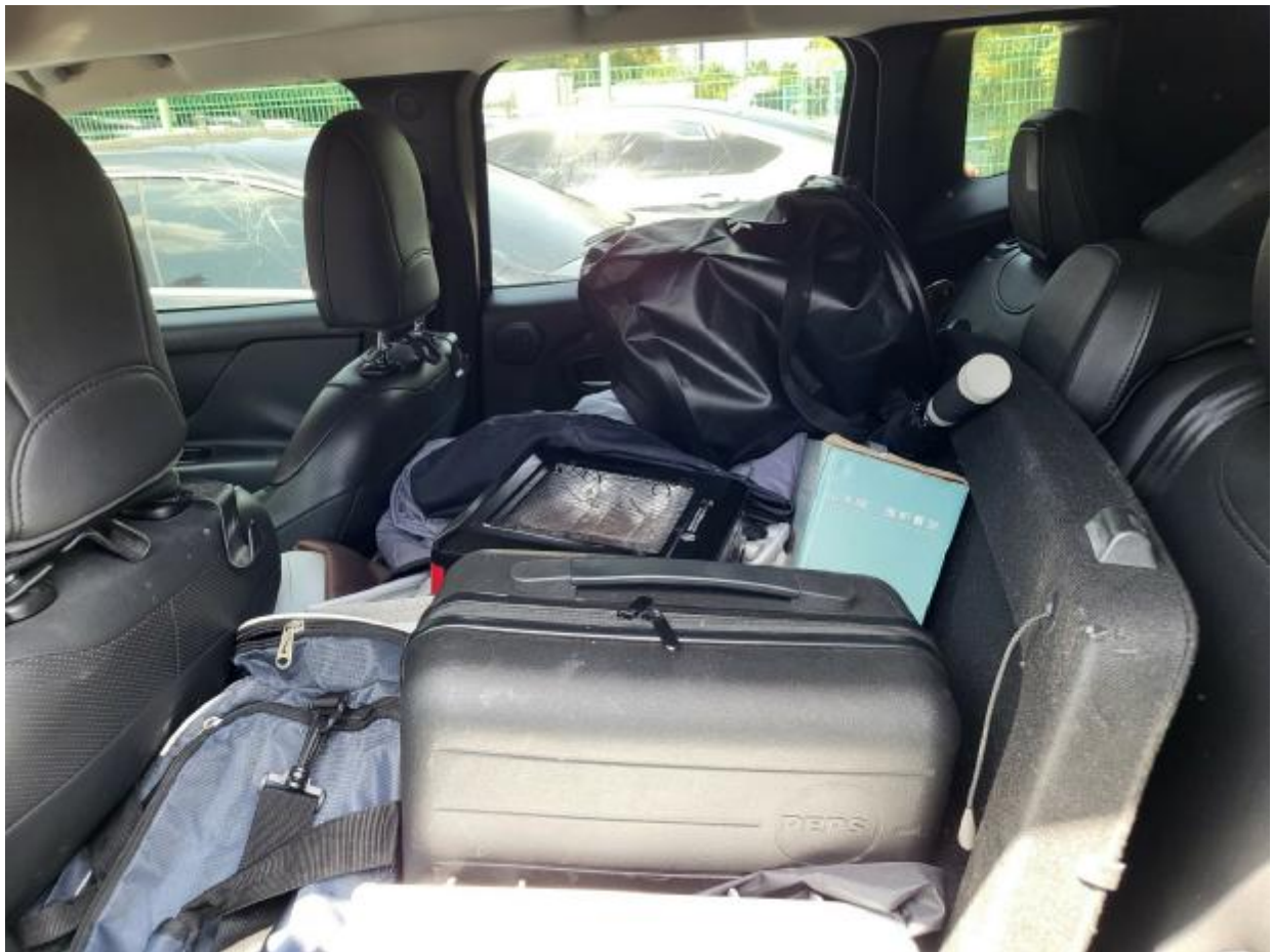
본 건 내 부