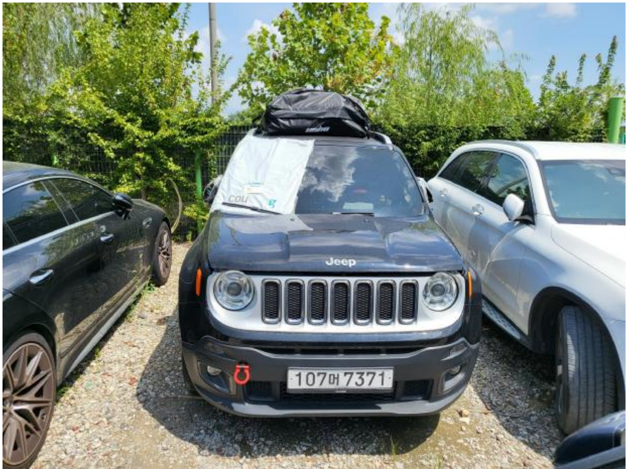
본 건 전 면