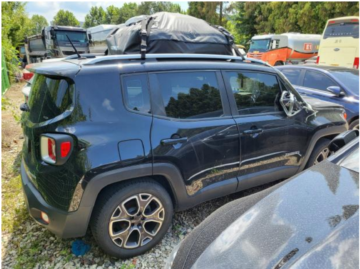
본 건 측면