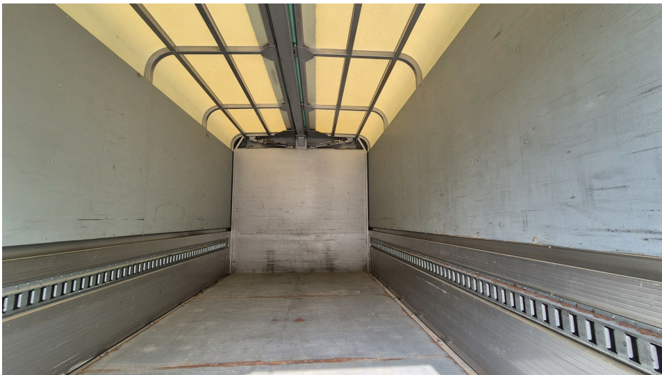
본건 적재함 내부