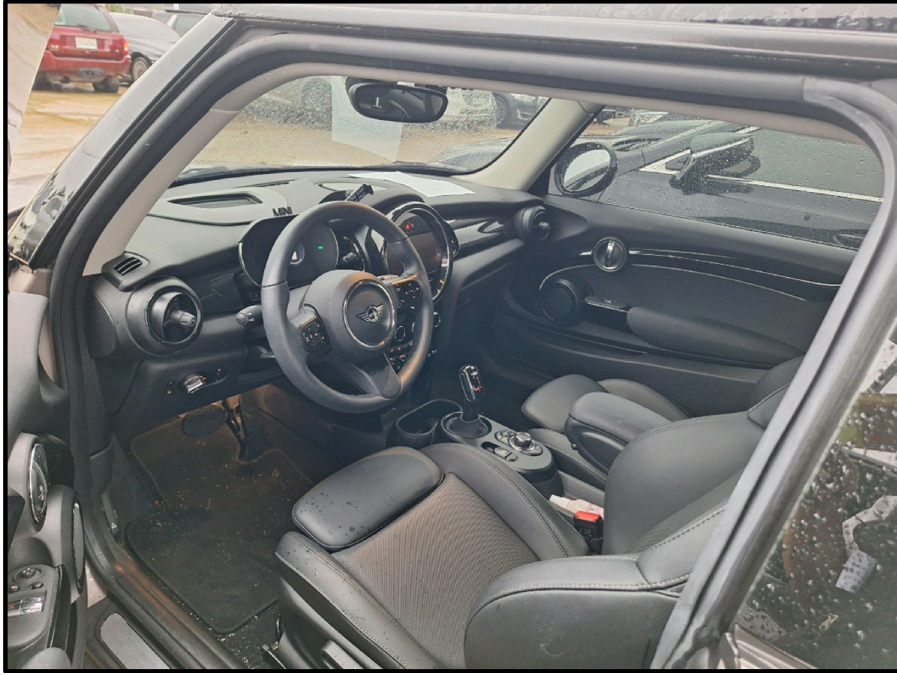
[ 1 ]