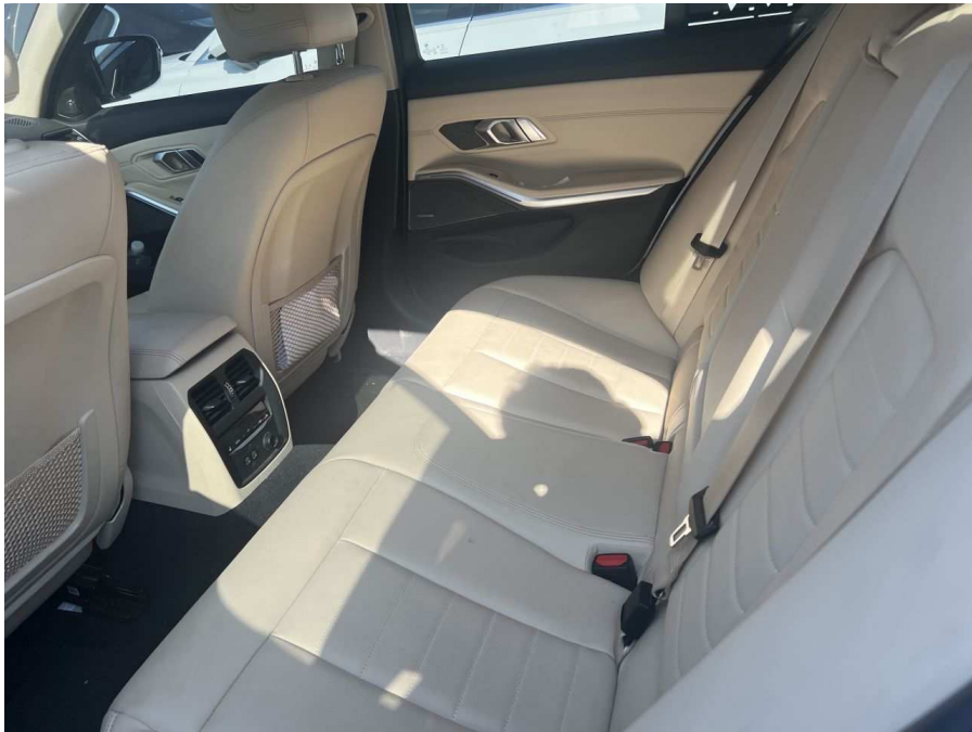
차량 내부 뒷좌석