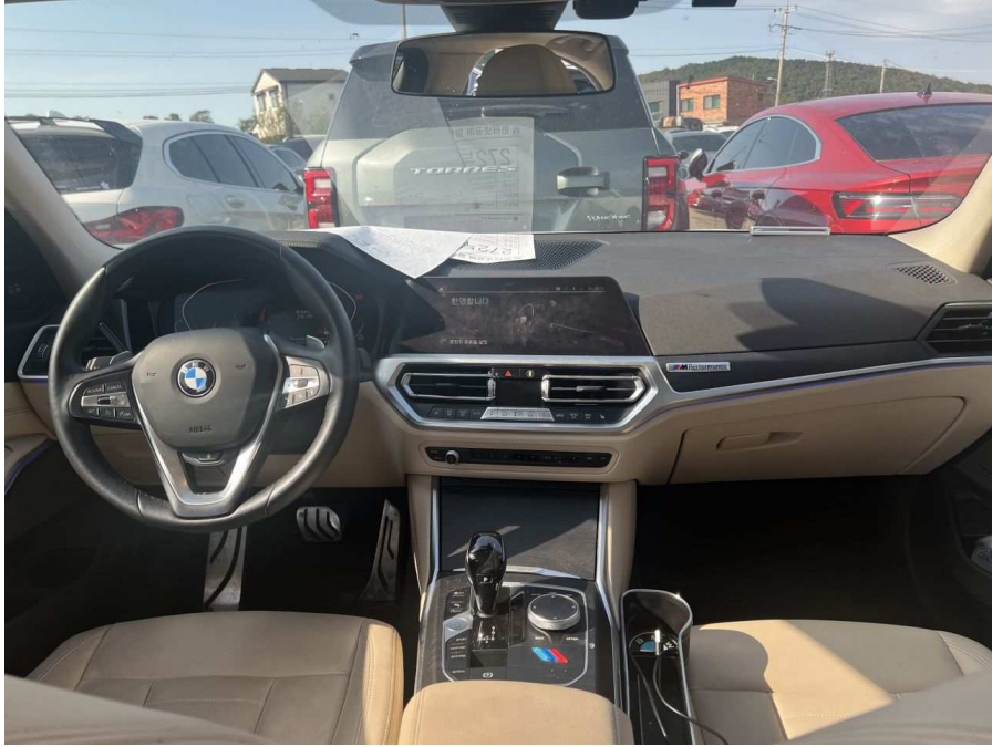
차량 내부 앞좌석