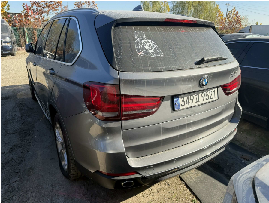
본건 후면부 2