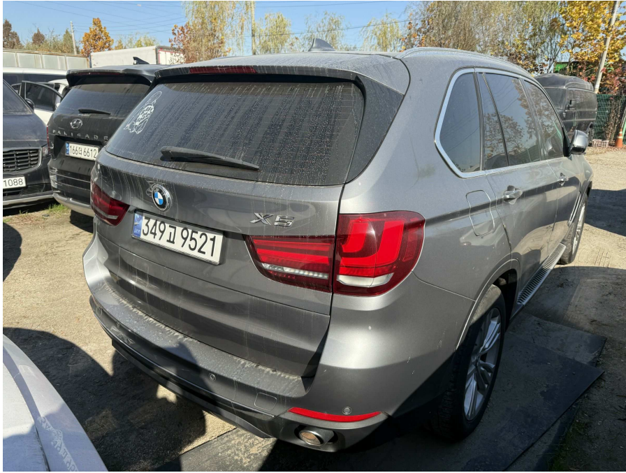
본건 후면부 1