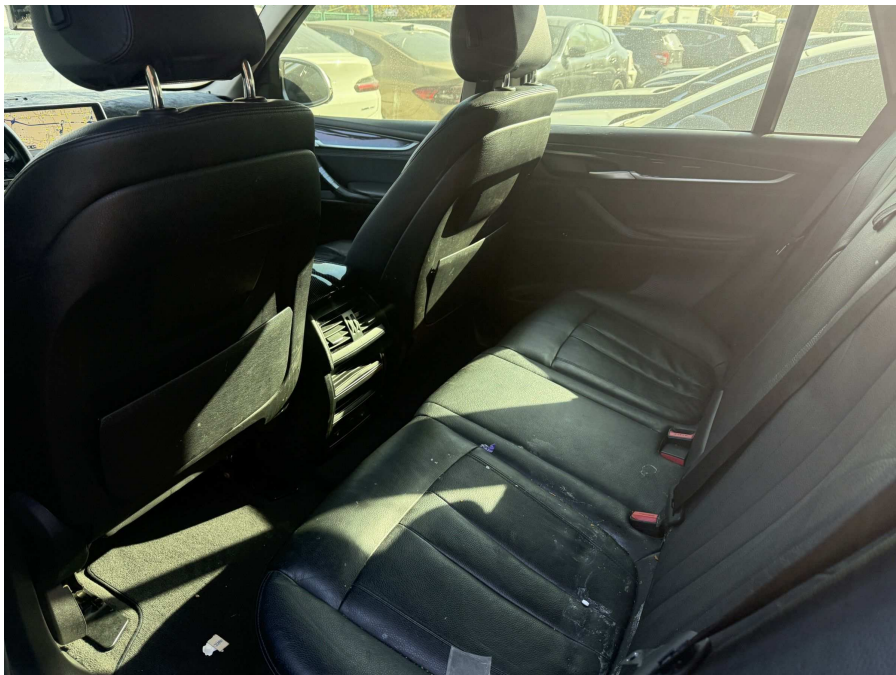
본건 내부 2