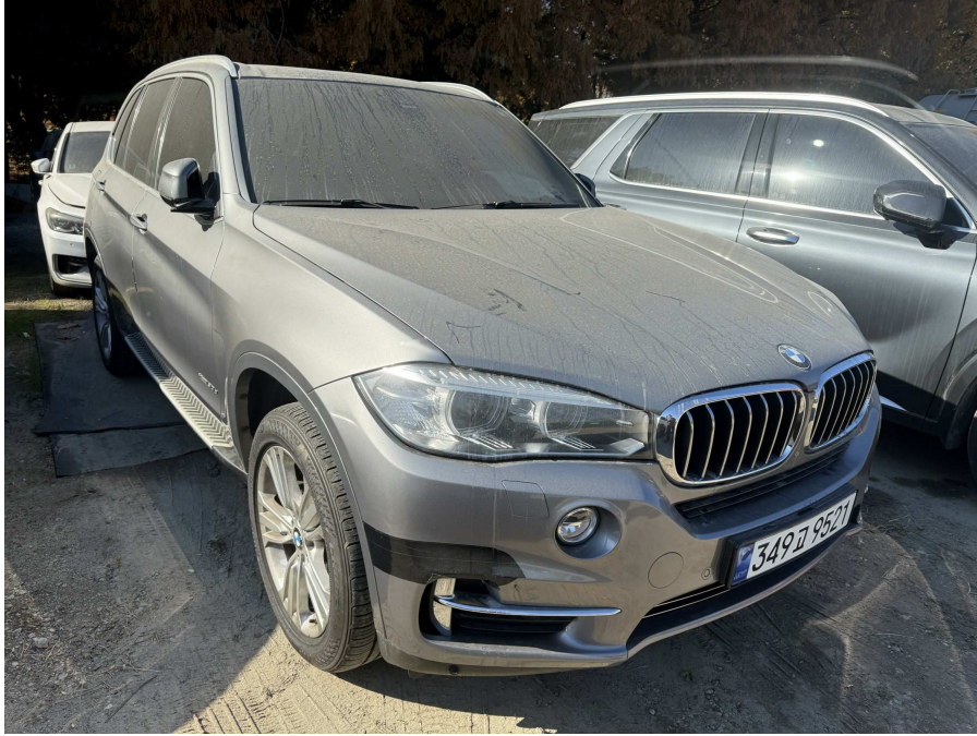
본건 전면부 1