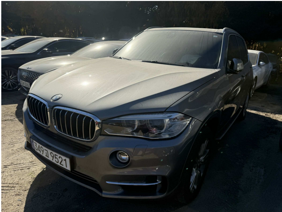
본건 전면부 2