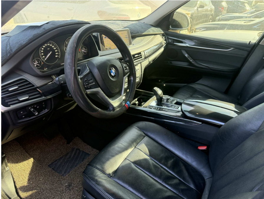
본건 내부 1