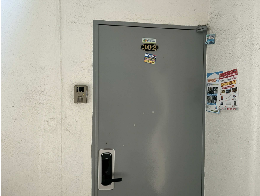
본건 외부 현황