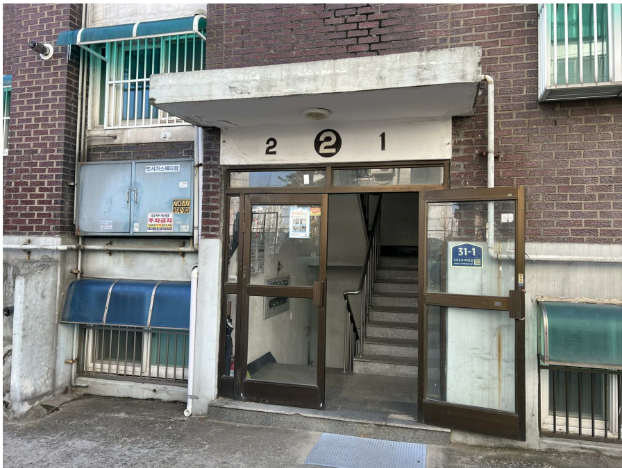
1층 출입부 현황