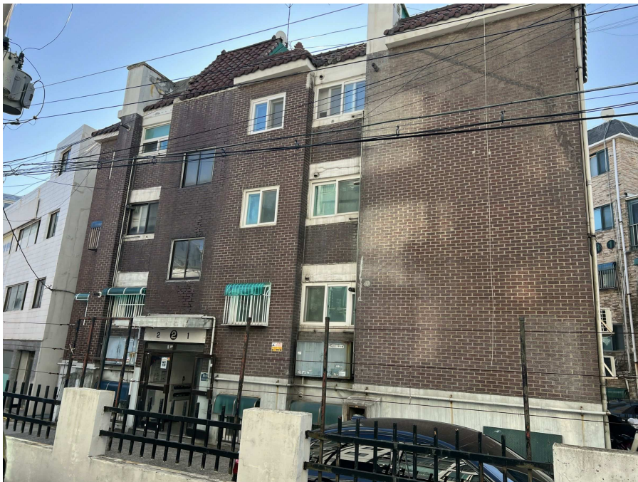
본건 전경 2