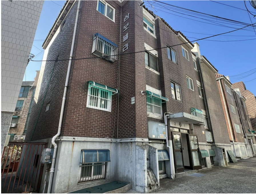
본건 전경 1