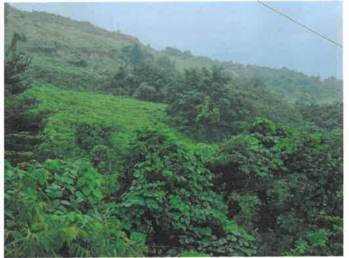
본건 일부 전경