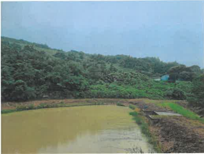
본건 일부 전경