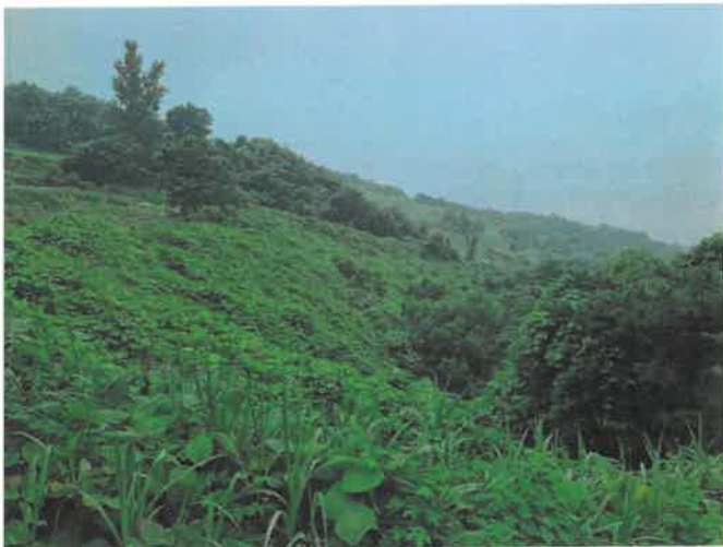
본건 일부 전경