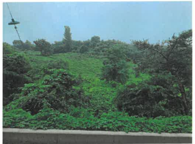
본건 일부 전경