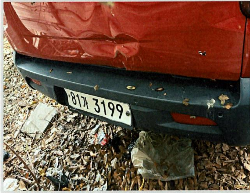
【본건 후면 번호판】