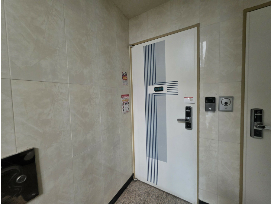
본 건 현 관