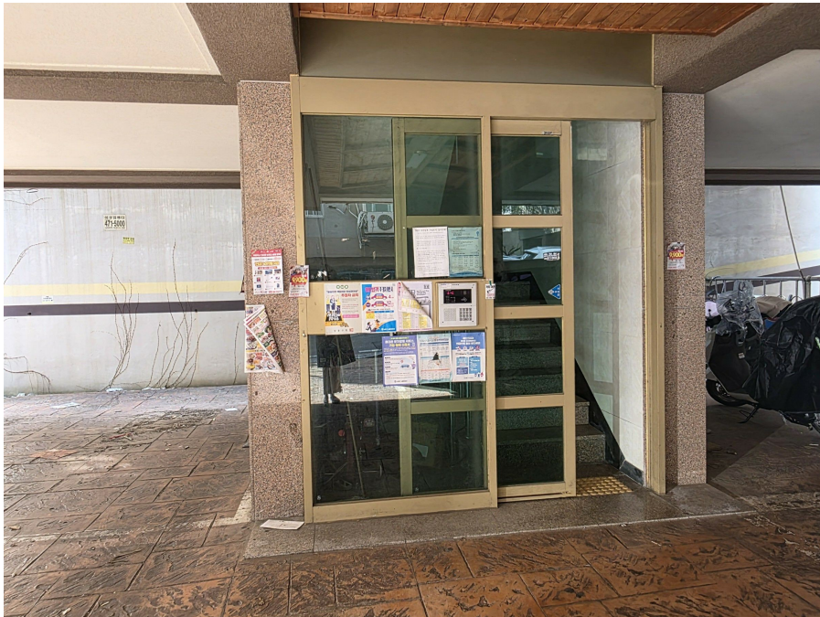
공 동 현 관