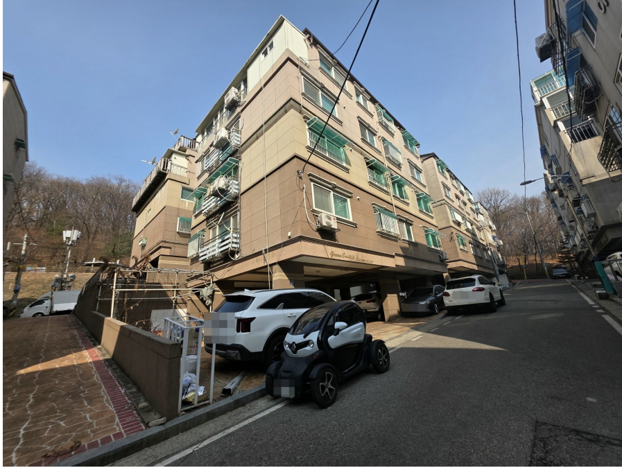
본 건 전 경