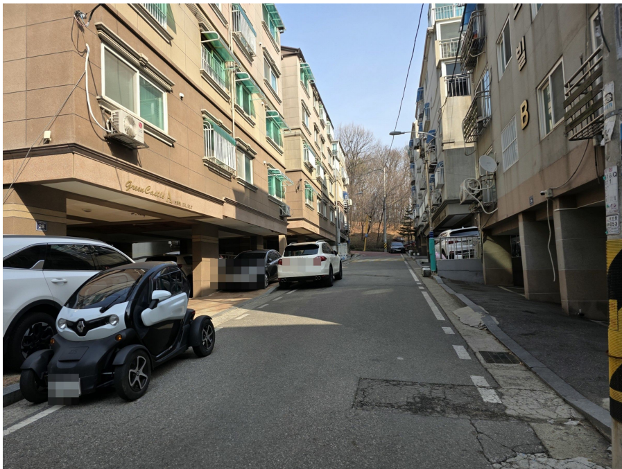
인 접 도 로