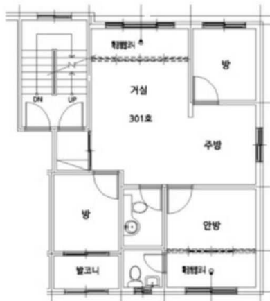
< 내부구조도 >