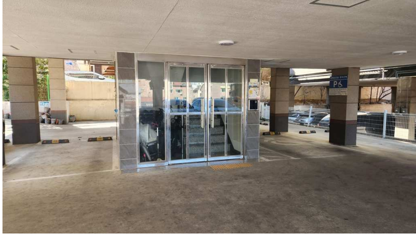
본건(모드니에꿈) 공동출입구 및 주차장