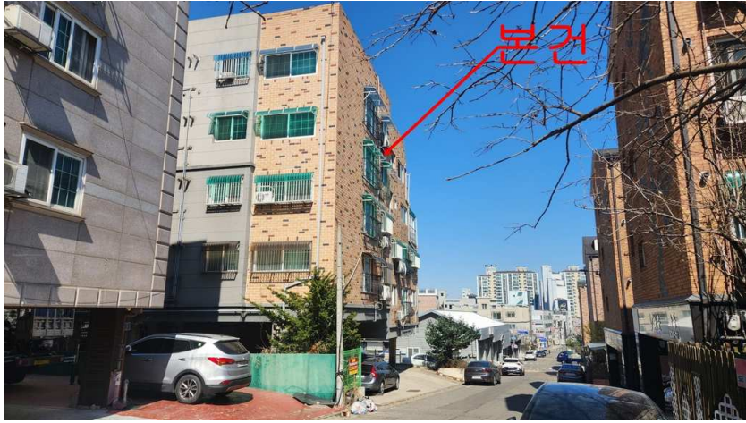
본건(모드니에꿈) 전경: 남동측에서 촬영