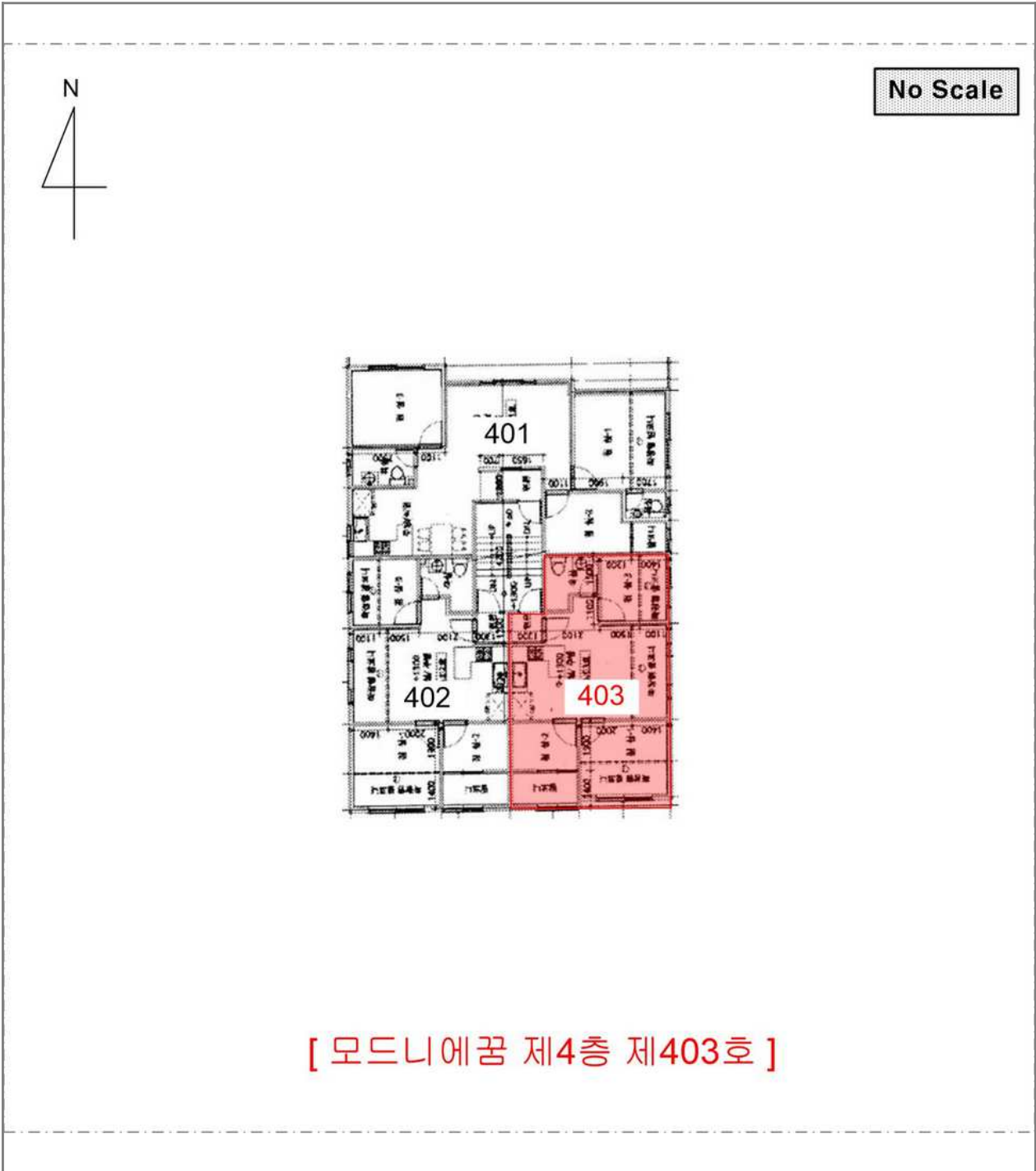
[ 모드니에꿈 제4층 제403호 ]