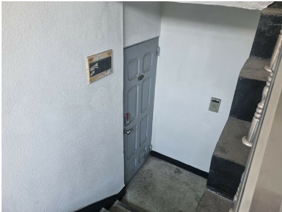
( B02 1 )