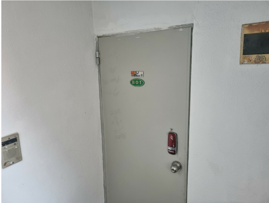
( B01: 2 )