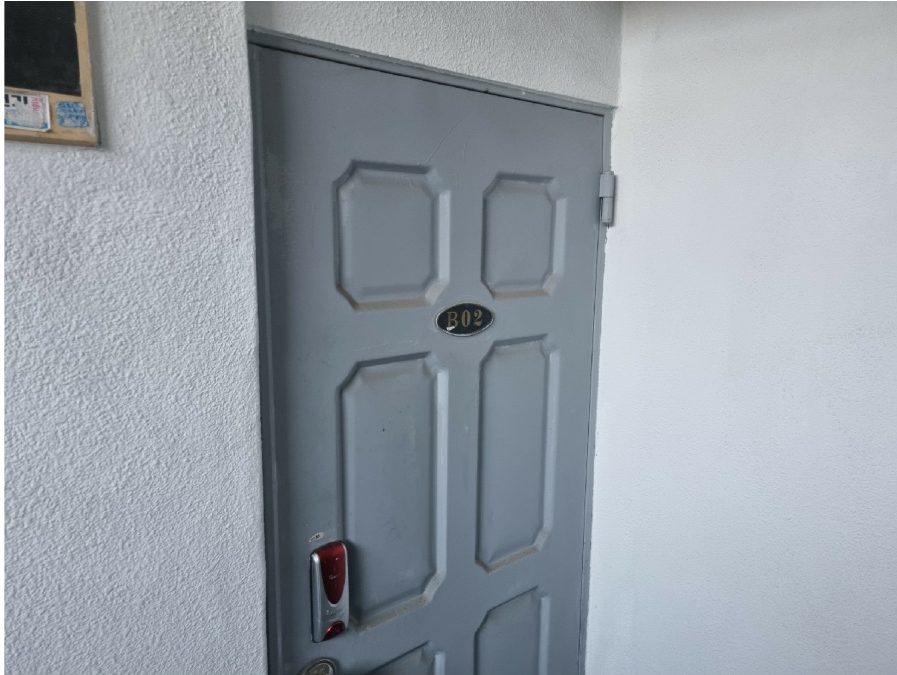
( B02 1 )