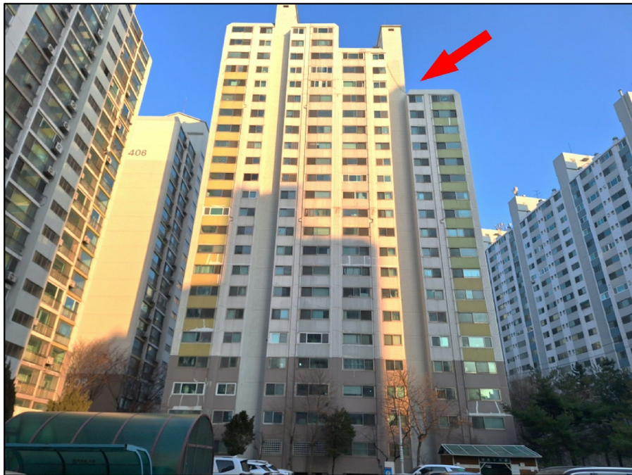
[ - ]