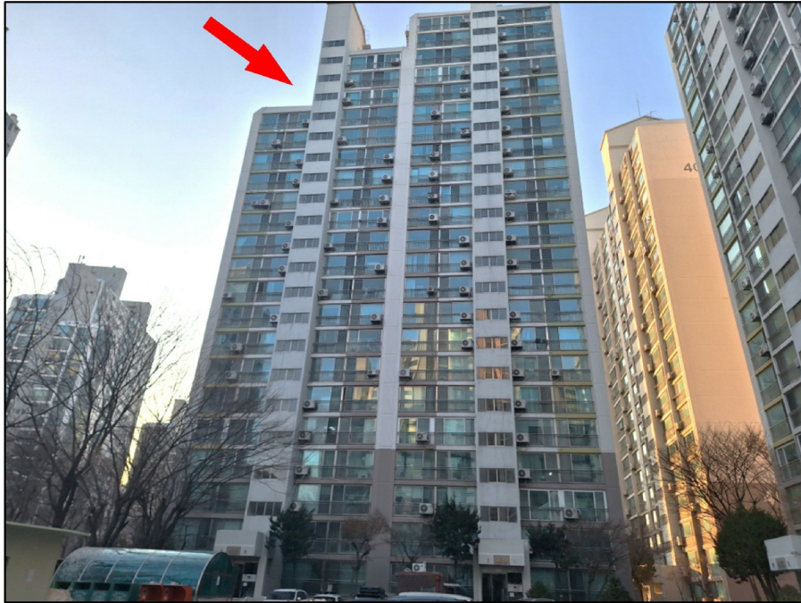
[ - ]