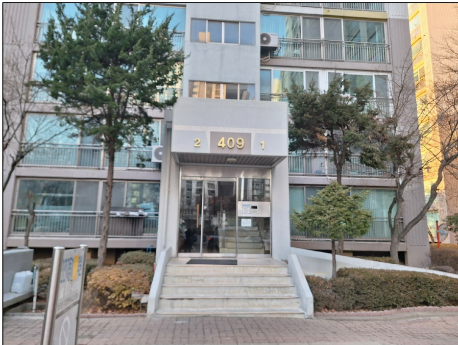
[ 1 ]