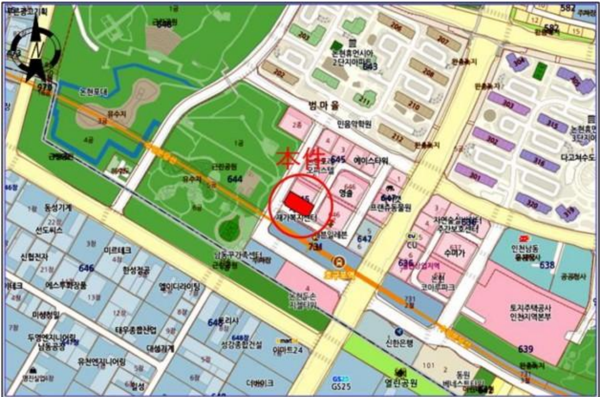
호 별 배 치 도