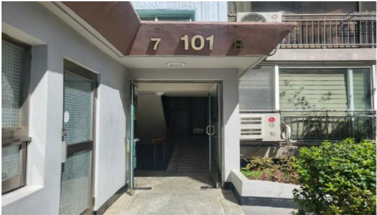
본 건 출입 구