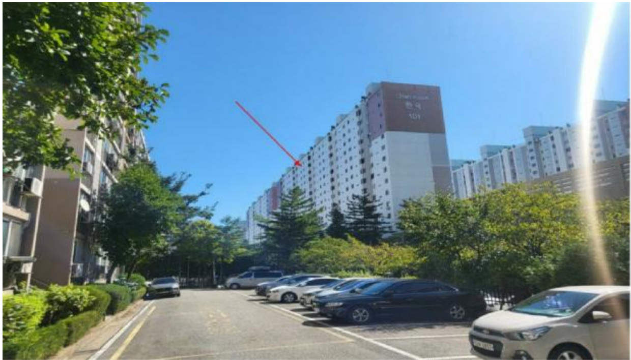
본 건 주 위