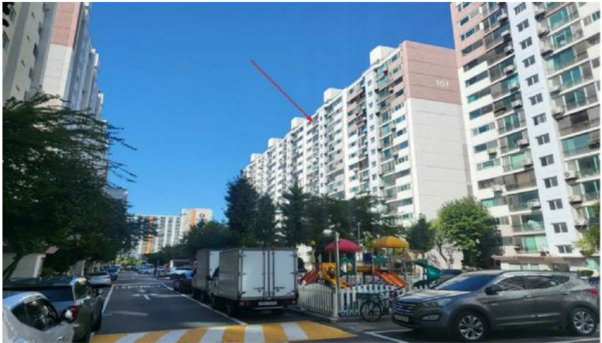
본 건 전 경