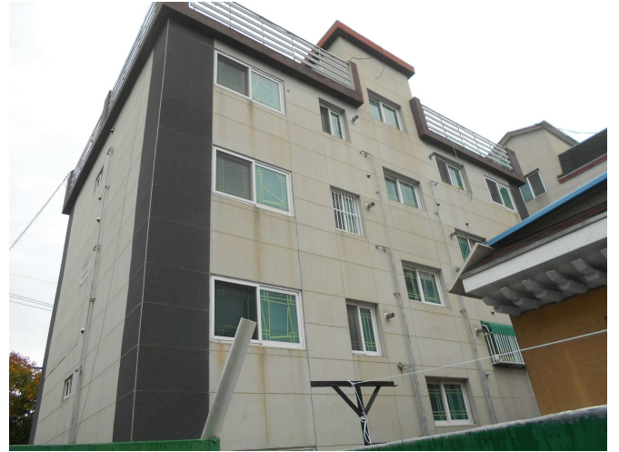
본건 전경2(남서측 인근에서 촬영)