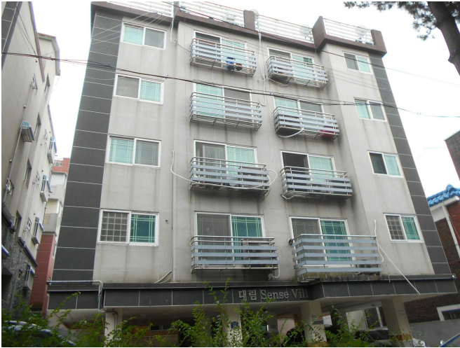
본건 전경1(북측 인근에서 촬영)