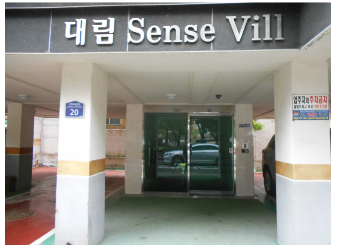
1층 출입구 전경