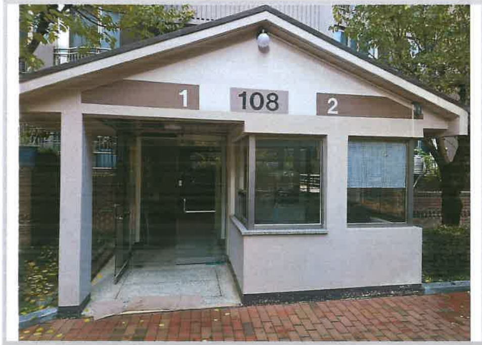
108동 1,2호 라인 1층 출입문