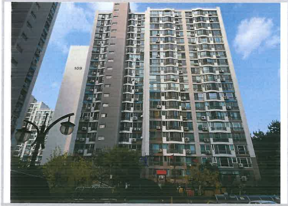
108동 외부 전경