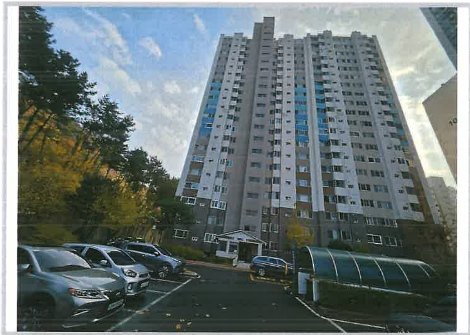
108동 외부 전경